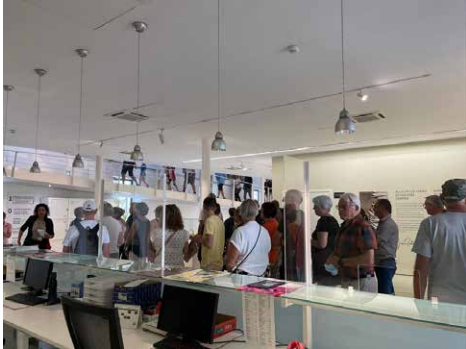
Figura 7. Visitants de TUI.

A més, la institució ha rebut la sol·licitud de col·laboració de l'important operador turístic TUI, que pretén incorporar el Museu inquer com una de les visites fixes de les seves excursions (fig. 7 i 8). Per altra banda, el Museu ha rebut visites de diferents professionals de museus interessats en el projecte, i s'han incrementat també de forma molt significativa les donacions o cessions de nous objectes per a la col·lecció.