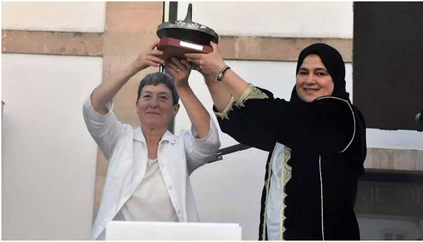
Figura 5. Lliurament simbòlic a la comunitat del trofeu obtingut a l'European Museum Forum, a la festa per a la celebració del premi.

La distinció amb aquest premi suposa un immediat interès pel Museu per part de nombrosos mitjans de comunicació locals, autonòmics i nacionals, a més de rebre la felicitació per part de l'ICOM (International Council of Museums), de l'ambaixada espanyola a Estònia i d'altres organismes culturals i polítics.