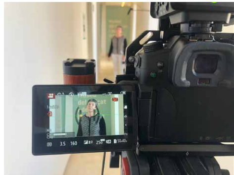
Figura 1. Moment de gravació del vídeo durant la jornada familiar al Museu, amb una de les col·laboradores habituals.

Per dur a terme aquest vídeo, es va convocar novament els voluntaris, col·laboradors i públic habitual del Museu perquè participassin en una jornada familiar en què es dugueren a terme tallers i una gimcana que foren enregistrats. A més, es feren entrevistes breus a aquestes persones en les quals es demanaven respostes ràpides a preguntes com: “què significa el Museu per a tu?”, “per què és important el Museu?”, etc. (fig. 1).