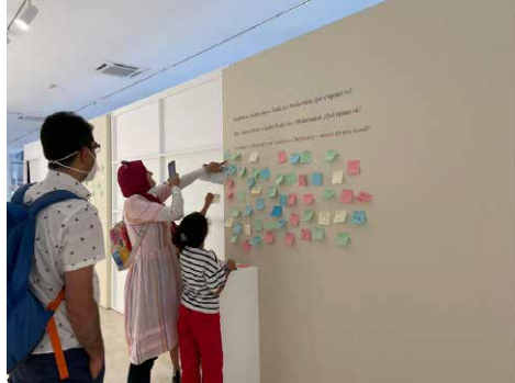
Figura 8. Visitants procedents d'Egipte participant en una de les propostes educatives del Museu.