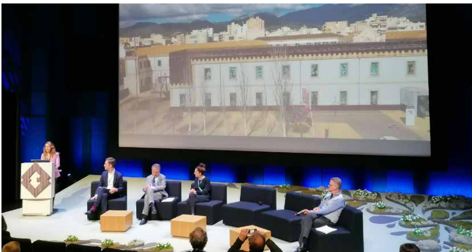
Figura 2. Presentació del Museu del Calçat i de la Indústria durant la conferència.

Aquests tres exemples són una petita mostra de les 60 propostes dels museus nominats l'any 2022 que representen els principis museològics que, segons les bases d'aquests premis, han de regir els museus en l'actualitat. Es tracta de museus redefinits, tots ells, des de la perspectiva de la sociomuseologia, i situen el visitant en el centre de la seva nova concepció.