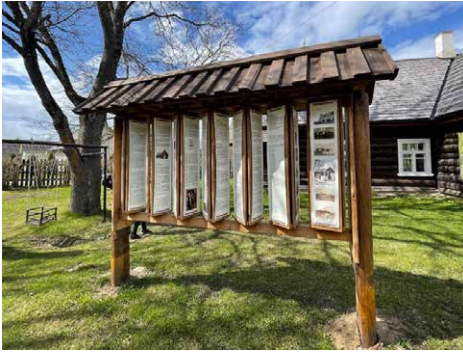
Figura 3. Setomma Museum. Solució museogràfica per mostrar diversos relats en un mateix espai.