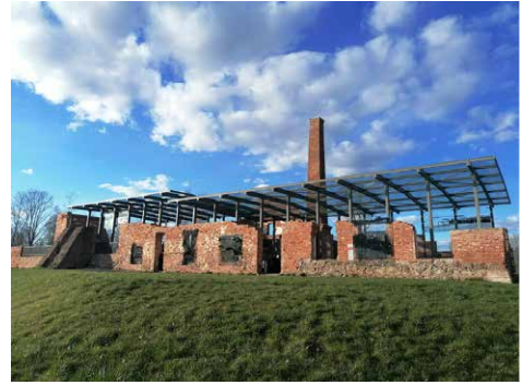
Figura 4. Museu Nacional d'Estònia a Tartu. Intervenció contemporània d'una antiga fàbrica.