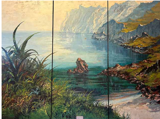
Figura 3. El Colegio Santo Tomás de Aquino – Liceo Santa Teresa acull aquest imponent tríptic de Valerià Pinell.

Entre les donacions del pintor perquè fossin de titularitat municipal, el text de Guillem Coll posa especial èmfasi en una: