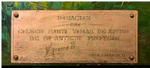
Figura 4. La dedicatòria de l'obra evidencia la vocació d'ensenyant del pintor català, que per a ell era motiu de gratitud.