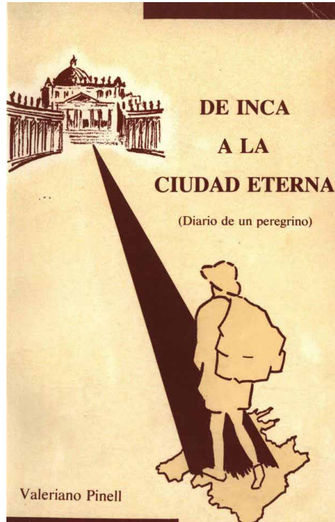
Figura 5. Edició, apareguda el 1985, del dietari que va escriure Pinell sobre el seu pelegrinatge a Roma i a la residència papal del poble de Castel Gandolfo.

Les vicissituds per les quals passà posteriorment el llegat municipal de Pinell afectaren de manera especial la seva donació més valuosa, la sèrie Catalunya , i arribaren a un punt crític el gener de 2005. Al deteriorament de les obres, s'hi sumava el fet que, d'un any ençà, estaven embolicades en un magatzem, amb la qual cosa s'incomplia una de les condicions que Pinell havia fixat per a la donació: que s'exposarien en un lloc destacat del Casal de Cultura. Per tot plegat, els hereus de l'artista arribaren a considerar la possibilitat d'exigir-ne la devolució. La resposta del consistori va ser que la retirada de la col·lecció era només temporal, mentre esperaven per dur-la a l'emplaçament definitiu, una de les sales situades entorn del Claustre de Sant Domingo, en el marc de la reforma per ubicar també a l'edifici de l'antic monestir altres dependències municipals,