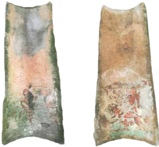
Figura 4. Exemple de dues de les teules pintades recuperades en què es poden reconèixer els motius representats d'una dona i un ca.

Pel que fa a la iconografia que es reproduïx a les teules recollides, aquesta s'ha hagut d'analitzar a partir de l'estat en què es trobaven les teules just després de la troballa, sense que haguessin estat objecte de cap mena d'intervenció de neteja o restauració, per la qual cosa els elements representats no sempre es poden apreciar amb el grau de detall esperat. En aquest punt podem assenyalar com trobam les pintures principalment a la part còncava, a 37 teules, tot i que a 13 d'elles apareix a la part convexa.