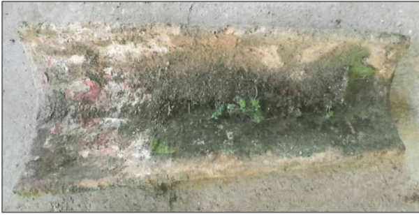
Figura 3. Exemple de l'estat de conservació en què es va recuperar una de les teules. Atria desconeguda, fons de l'Àrea d'Urbanisme d'Inca.

totes aquestes fractures puguin ser històriques; per tant, podem plantejar la possibilitat que algunes d'aquestes puguin ser recents i que s'hagin pogut produir a partir de la seva manipulació durant la seva retirada o custòdia.