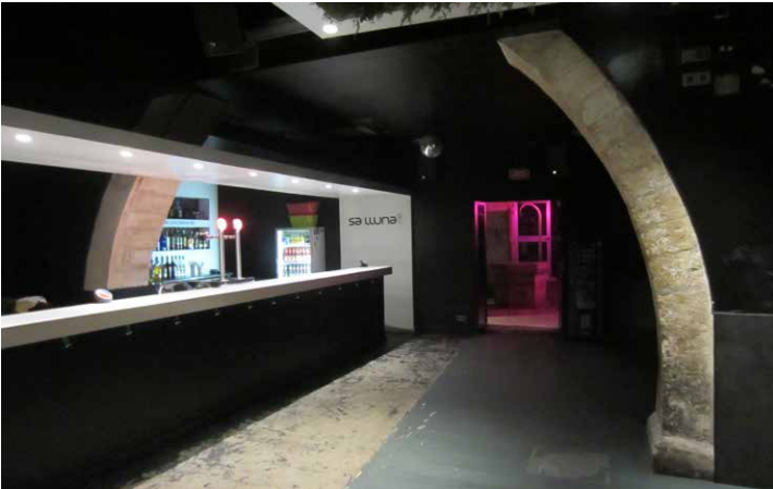
Figura 3. Pub Sa Lluna.