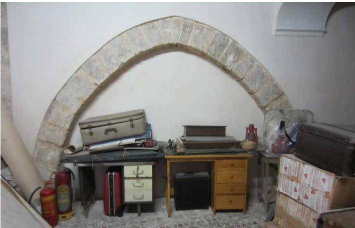
Figura 4. Posada de Son Gual.