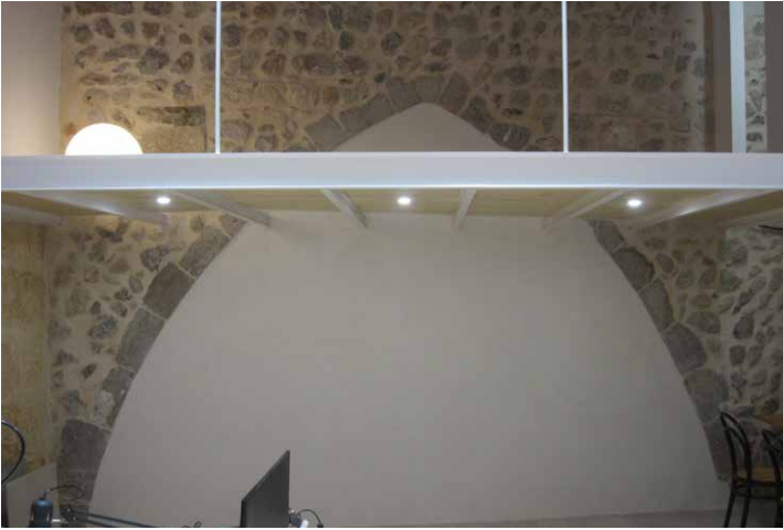
Figura 2. Ca n'Antoni Prat.