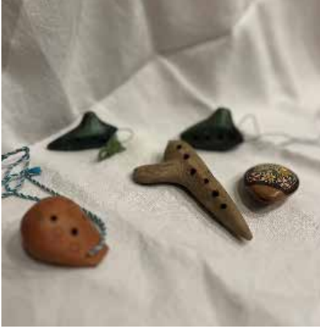
Figura 7. Ocarines americanes. La més grossa i llarga és una ocarina professional en si bemoll italiana.