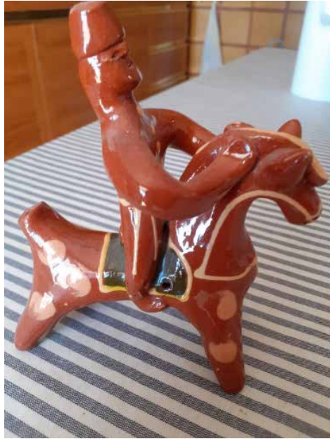
Figura 5. "Siurell" de Txecoslovàquia.