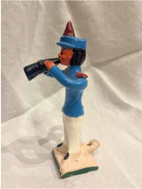
Figura 4. "Siurell" de Portugal.