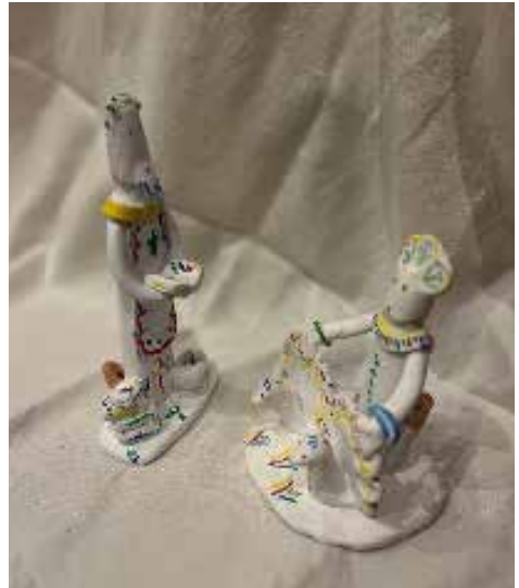
Figura 9. Siurells d'Inca.