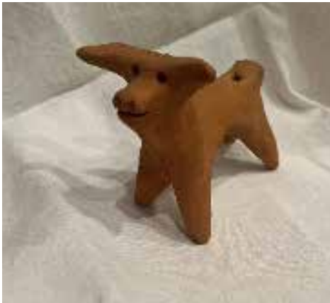
Figura 1. "Siurell" de Guadix.

El dia típic per comprar siurells és a les Fires d'Inca, al Dijous Bo, a les romeries i durant la de Sant Marçal, celebrada el 30 de juny al santuari de sa Cabaneta.