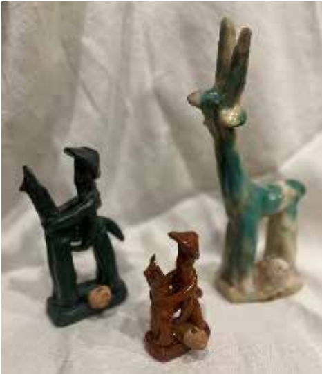
Figura 8. Siurells vidriats d'Inca.

El lloc on es podia trobar la seva venda era a les Fires d'Inca, al Dijous Bo, a la romeria de Sant Marçal i a altres mercats, fires i celebracions.