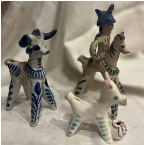
Figura 3. "Siurells" de Granada.