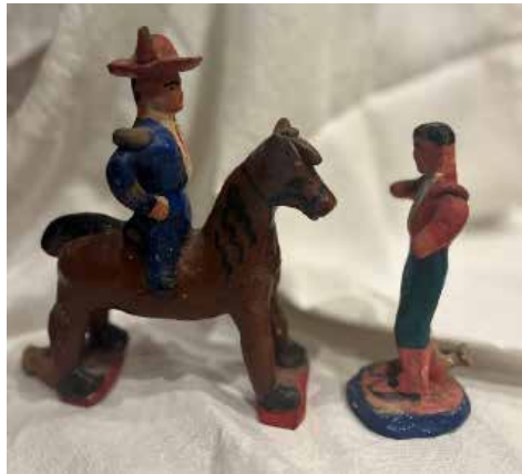
Figura 2. "Siurells" de Granada.