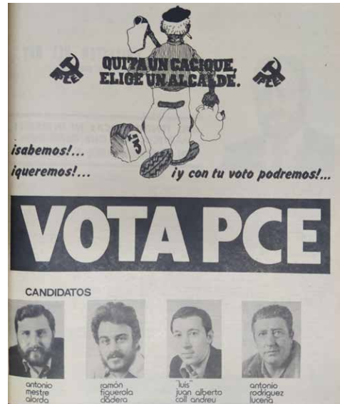
Figura 4. Anunci electoral de la candidatura del PCIB.