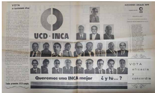
Figura 2. Anunci de la candidatura d'UCD (font: Dijous , 29 de març de 1979, p. 8).