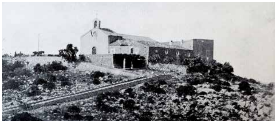
Figura 4. El puig de Santa Magdalena principis del segle XX

Dins la carpeta núm. 2519 de l'Arxiu Històric Municipal d'Inca (Santa Magdalena), a més dels documents citats amb anterioritat, podem veure un foli solt i escrit a ambdues cares, que diu: