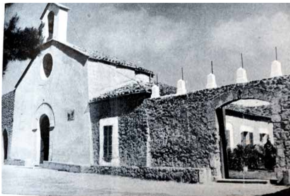
Figura 5. Façana de l'església i la clastra a mitjans del segle XX.

L'Ajuntament d'Inca, en moments molt anteriors "Universitat de la vila d'Inca", tengué esment i pagà tots els treballs, les funcions, els adobs, les festes, etc. de l'oratori de Santa Magdalena del Puig d'Inca. Es tenia la convicció recta que tot el puig era una comuna, com s'intenta demostrar i es demostra clarament mitjançant l'oportuna i verídica documentació que tenim. Un caramull de documentació que va donant pistes de les parets divisòries i confrontants que van acostant-se a la zona pertanyent a la vila d'Inca i, per tant, a la Universitat. Batle reial, jurats i consellers van donant camins que condueixen a l'aclariment del tema, però, passats els anys, es va oblidant. L'any 1932, part del consistori majoritari de l'Ajuntament anà descobrint enclotxes de la coneguda com a "donació" al Sr. Bisbe de Mallorca. Les queixes foren clares i contundents. Les investigacions foren netes. La justícia havia d'actuar i, com ho va fer amb el carrer de "La Esperanza" dins el convent dels Franciscans, donà la raó a l'Església i condemnà el consistori republicà a amollar el mac oblidant velles i antigues raons.