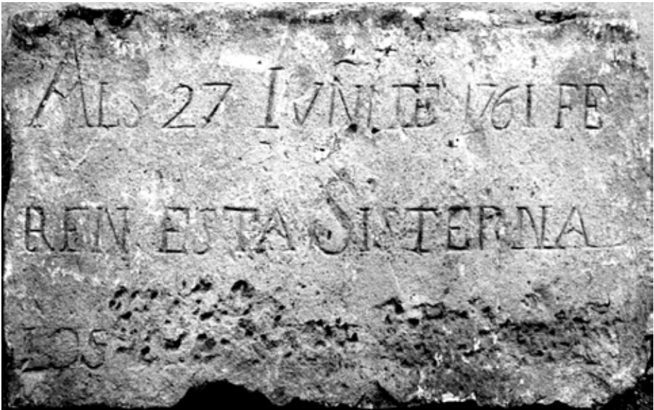
Figura 1. Làpida trobada en el Puig d'Inca amb una part repicada.