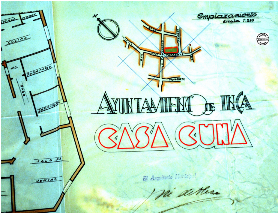
Figura 4. Plànols de l'arquitecte Josep d'Olesa de l'edifici actual. 1927

Constància, 21 però es posaven les condicions que s'havia de començar el 1927 i hauria d'estar acabat el 1930, segurament el senyor de Can Ripoll pensava que d'aquesta manera es rompia la inèrcia del parlar i no fer que hi havia a l'Ajuntament.