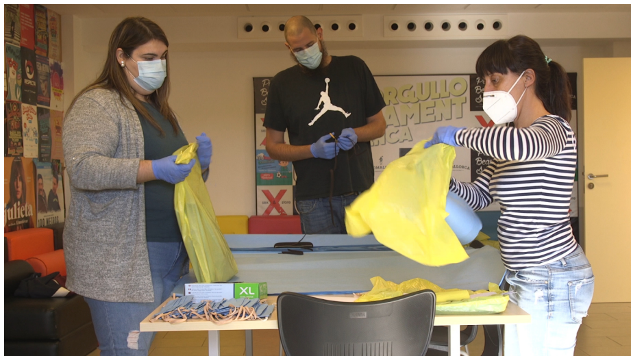
Figura 3. Equip de Participació Ciutadana i Joventut de l'Ajuntament d'Inca elaborant bosses de material per distribuir entre les voluntàries

En unes setmanes en què tots els comerços estaven tancats degut al confinament i era impossible comprar materials per confeccionar aquestes mascaretes casolanes, van ser molts els veïns que possibilitaren aquesta col·laboració donant elàstics, filferros i fils. El teixit de les mascaretes va ser donat directament per l'Hospital, que es preocupà d'investigar si existia algun teixit adequat per protegir i que es pogués emprar per a l'elaboració de les mascaretes: A poc a poc vam anar veient com s'anava recomanant de