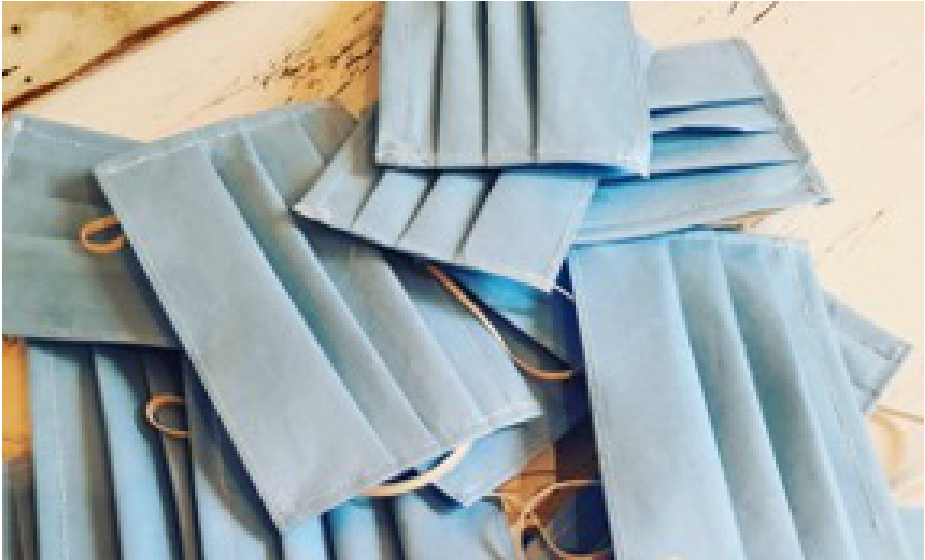
Figura 7. Mascaretes acabades