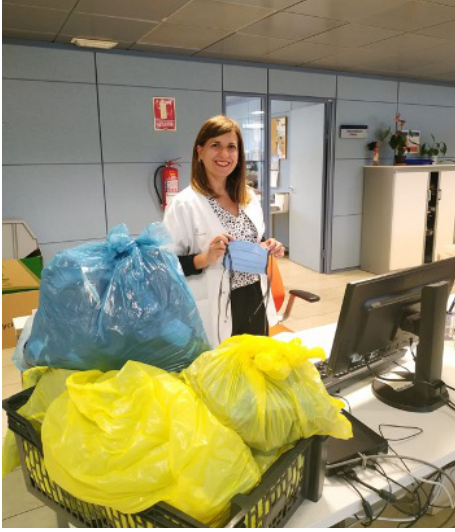
Figura 5. Personal sanitari rebent mascaretes de la iniciativa "Inca Repunta"

Des de l'Hospital es va gravar un vídeo explicant com s'havien de fabricar les mascaretes seguint el model de les mascaretes sanitàries homologades. A