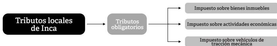
Figura 2. Sistema fiscal de la ciudad de Inca en el escenario 1

El escenario de derogar todas las ordenanzas fiscales reguladoras que no fuesen de imposición obligatoria es una opción que está al alcance de los ayuntamientos. Es decir, que los ciudadanos y empresas de la ciudad de Inca pagasen exclusivamente los impuestos que el TRLRHL fija como obligatorios: el IAE, el IBI y el IVTM. De esta manera el mapa tributario del municipio quedaría de la siguiente manera: