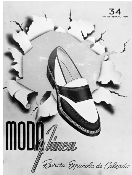
Fig. 3. Portada de 1950

en la moda i el disseny del calçat arreu de l'Estat, i portaveu dels productes espanyols en els mercats estrangers. L'editorialista deia que en aquells anys s'havien publicat almanco set revistes semblants a Moda y Línea , però que havien tengut una duració efímera. Per seguir essent la revista de referència a l'Estat es proposaven diversos canvis com per exemple reduir la seva mida per fer-la més pràctica, fer una revista més professional que “quede liberada en su presentación y contenido de las ampulósidades de la publicaciones destinadas al gran público y que constituya por tanto una guía eficaz a nuestros modelistas, de fácil manejo y consulta”. El format era de butxaca de 18 x 23 centímetres, i en comptes de tenir unes 32 pàgines passava a tenir-ne més de 100. S'anunciava que les pàgines interiors també serien en color i quant a la periodicitat, en comptes de ser de quatre números a l'any, passaria a tenir-ne només dos: primavera-estiu i tardor-hivern. 8