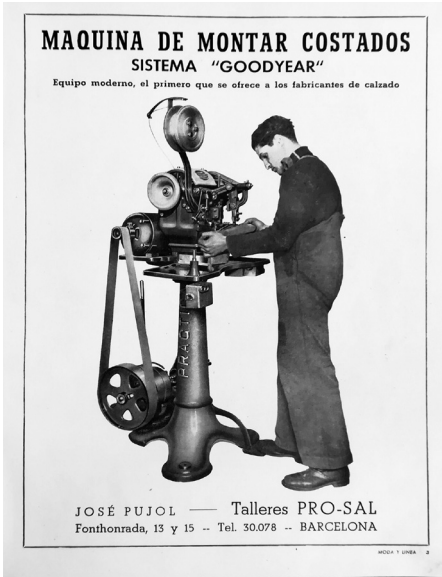
Fig. 8. Publicitat de maquinària Goodyear