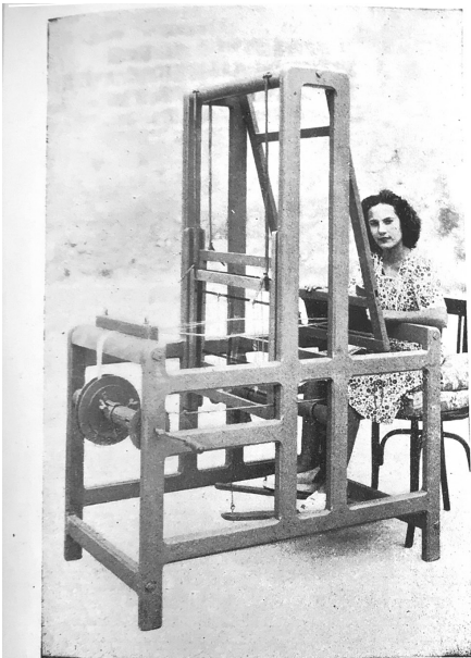
Más de 200 TELARES instalados en Mallorca

Ja en els primers números, es diu que la revista és distribuïda arreu de l'Estat. Hi ha una estructura de representants que fan arribar la revista per tot el territori. En els exemplars dels primers números apareixen els llistats de les ciutats on hi ha representants (Barcelona, Palma, València, Saragossa, Alaior, Las Palmas de Gran Canària, Palència...). Però a partir de l'any 1946, en el