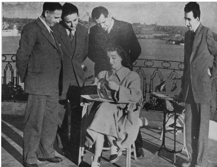
Fig. 7. Patricia Roc en el rodatge de la pel·lícula Jack el Negro llegint la revista Moda y Línea