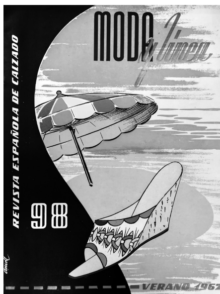
Fig. 5. Portada de 1962