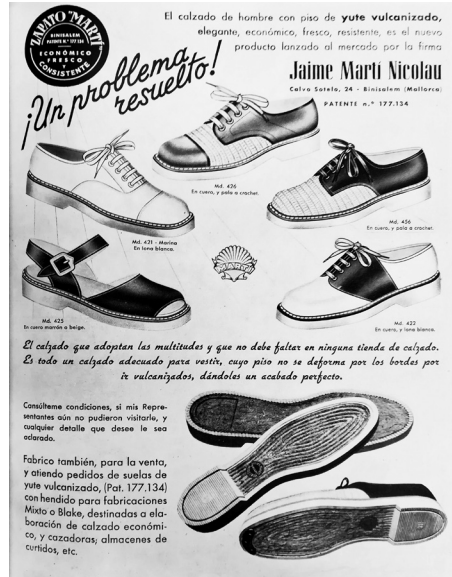
Fig. 9. Publicitat de calçat amb sola de fibra vegetal

Ja en els primers números, es diu que la revista és distribuïda arreu de l'Estat. Hi ha una estructura de representants que fan arribar la revista per tot el territori. En els exemplars dels primers números apareixen els llistats de les ciutats on hi ha representants (Barcelona, Palma, València, Saragossa, Alaior, Las Palmas de Gran Canària, Palència...). Però a partir de l'any 1946, en el