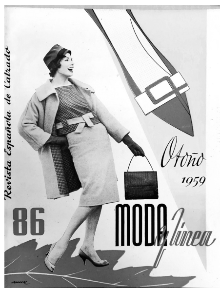
Fig. 4. Portada de 1959