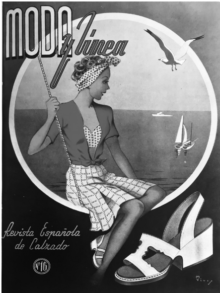
Fig. 2. Portada de 1947