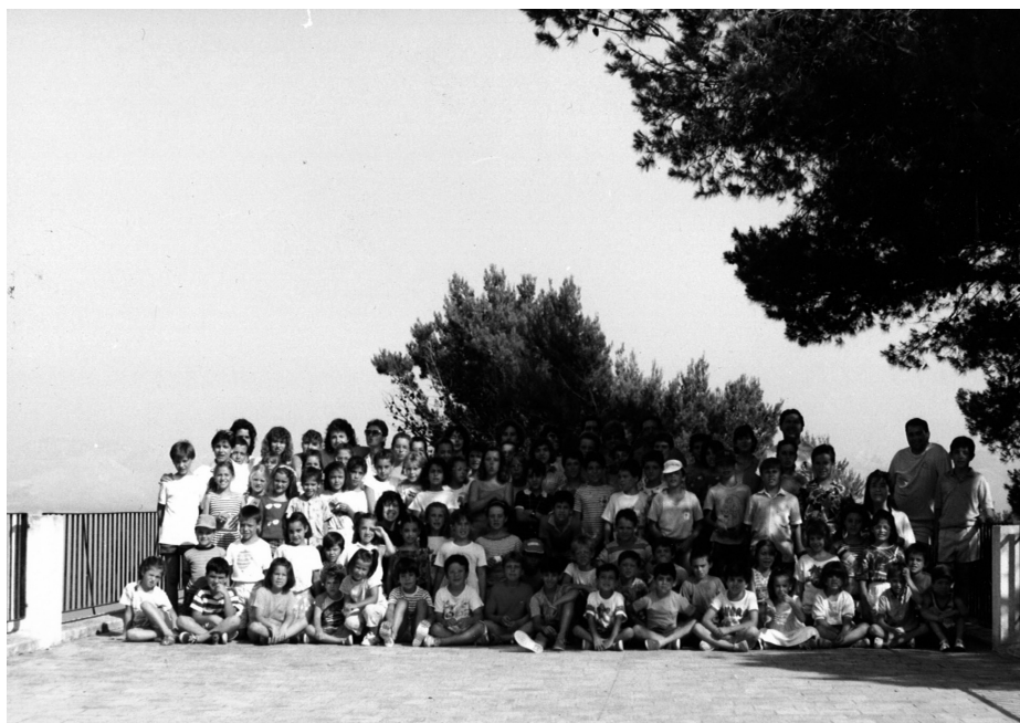
Fig. 4. La totalitat de nins i monitors assistents a una de les colònies a l'alberg de la Victòria, les instal·lacions del qual són idònies per dur a terme aquesta mena de convivències estiuenques. Al fons, hi tenim la mar i una petita platja on els al·lots prenen el bany diari, i més al fons, tot i que no es veu, la Talaia, una muntanya d'excursió obligada per als més majors, des d'on es contemplava la sortida del sol