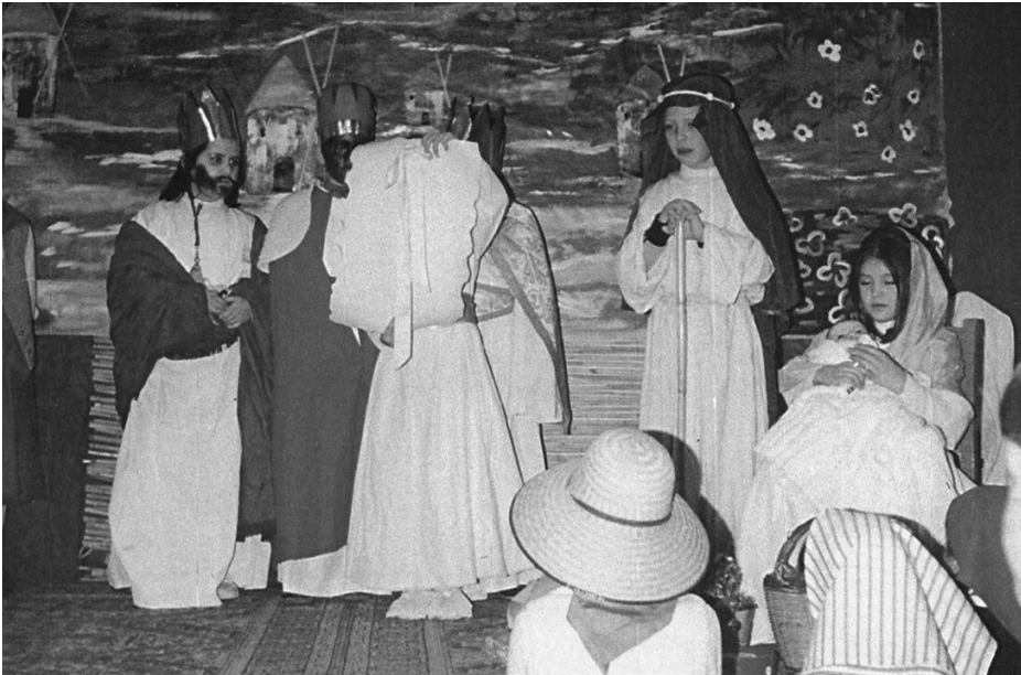
Fig. 5. Representació del naixement del bon Jesús al teatre de la rectoria