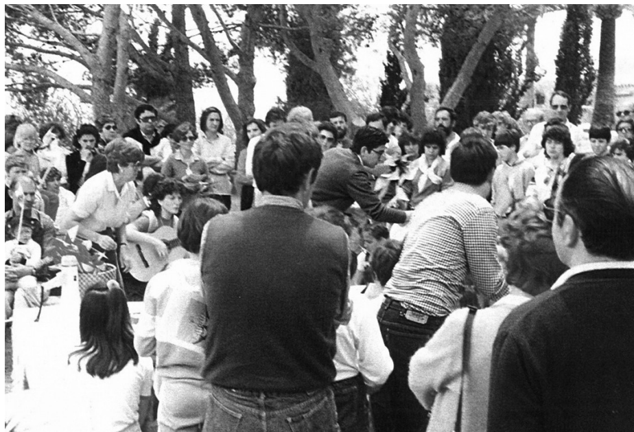
Fig. 8. Diada de Pares de l'Esplai, a l'ermita de Bonany de Petra