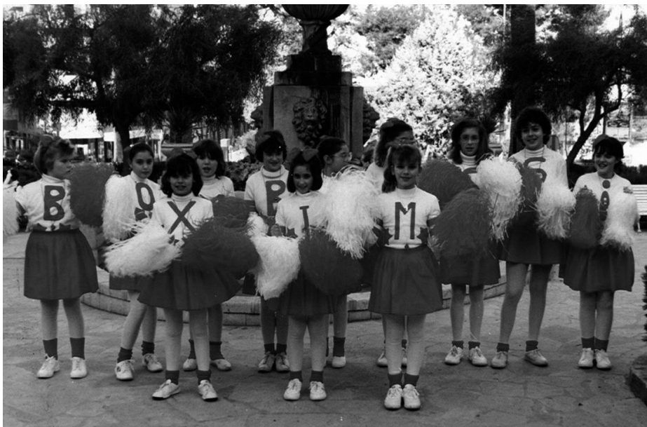
Fig. 12. El grup "Ximbombers" obtingué el primer premi de la Rua d'Inca amb la comparsa "Animadores de rugbi"