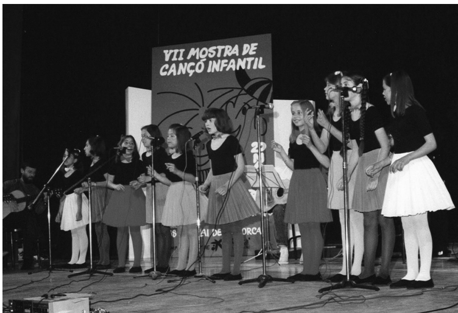
Fig. 7. El grup "Bugui-Bugui" al Teatre Principal de Palma defensant la seva cançó "El meu bosc"