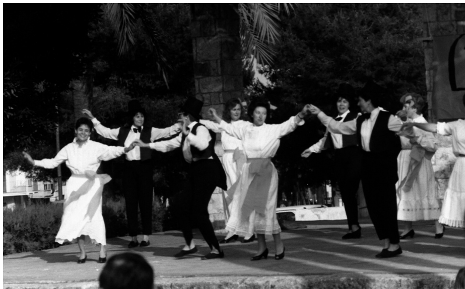
Fig. 11. El grup de mares de l'Esplai i la seva interpretació de "Cheek to Cheek" de la pel·lícula Sombrero de copa a l'antiga la plaça de Mallorca, com a col·laboració a la vetllada "Feim festa amb l'Esplai"