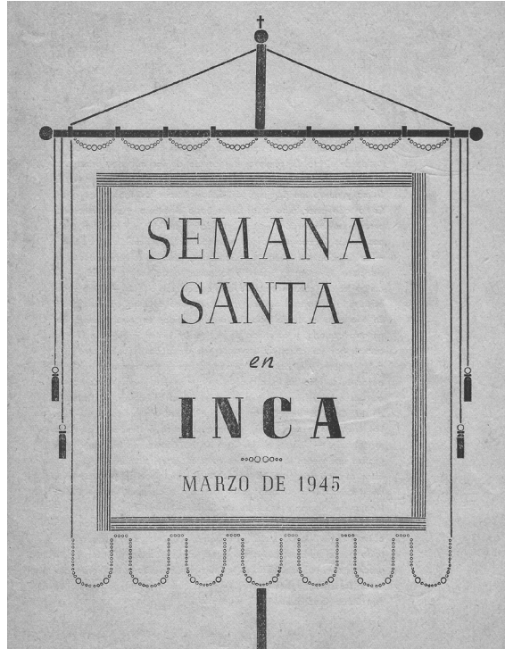
Fig. 2. Primer programa de Setmana Santa.