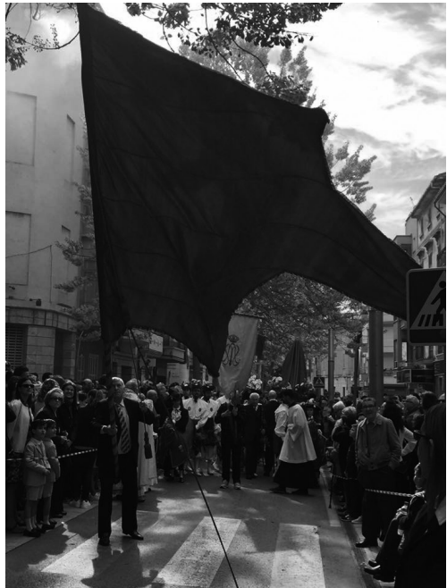
Fig. 7. El Penó Major.

Un altre element important dins el Diumenge de Resurrecció, que és a vegades oblidat, són els escopeters. Aquest element, antigament representat pels caçadors de la Ciutat, consistia a amollar “salvas” des dels balcons quan Jesús i Maria ja s'havien trobat. Era per celebrar la resurrecció de Crist i per avisar a tota la ciutat que Crist s'havia trobat amb la seva mare. Antigament en tot el recorregut des de Jaume Armengol fins a la parròquia de Santa Maria la Major els balcons estaven plens d'escopeters. Fa uns anys, com que havia decaïgut la participació, s'intenta fomentar