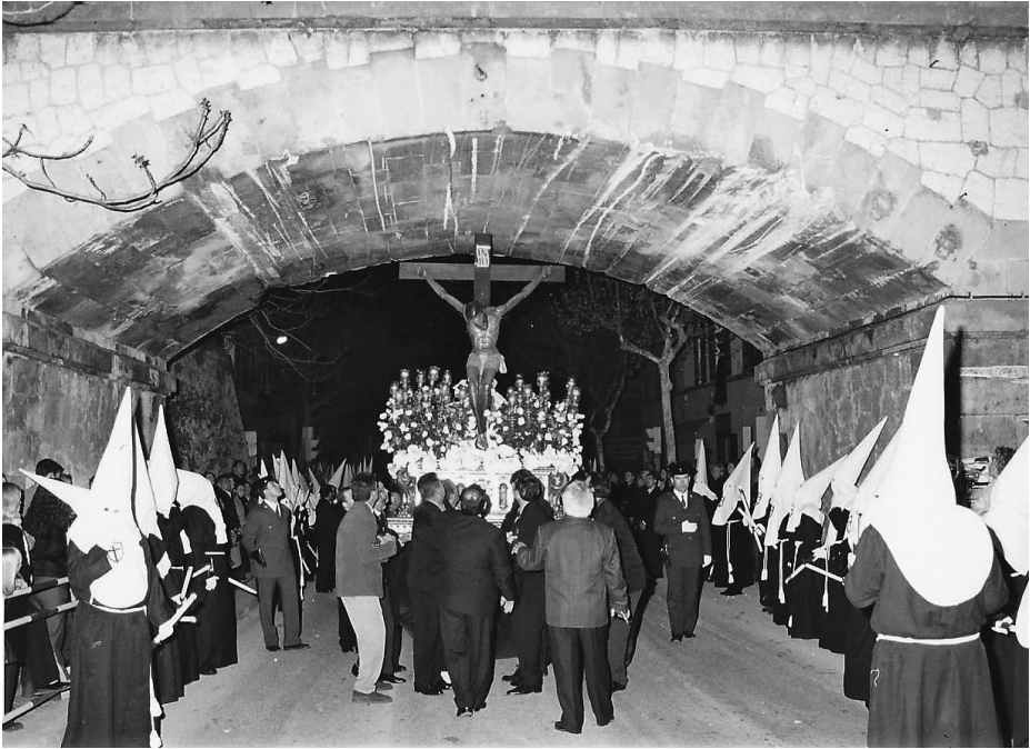
Fig. 4. Sant Crist passant per davall el pont del tren.

El darrer canvi destacable de la processó del Dijous Sant es produí l'any 2018, en què se suprimí el tros del carrer de les Germanies, Sant Domingo, i la processó pujà pel carrer del Bisbe Llompart des del carrer Ramon Llull fins a l'església de Santa Maria la Major.