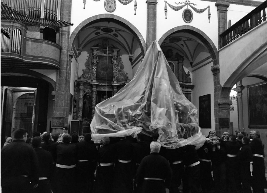
Fig. 5. La Dolorosa entrant de nou a Santa Maria la Major a causa de la pluja.

Sant Crist entrava a la parròquia de Santa Maria la Major el dia de la celebració. A Inca és necessari esmentar una tradició que s'ha conservat durant els anys i que està molt arrelada a la ciutat, són les tres Maries. És de destacar la següent cita: