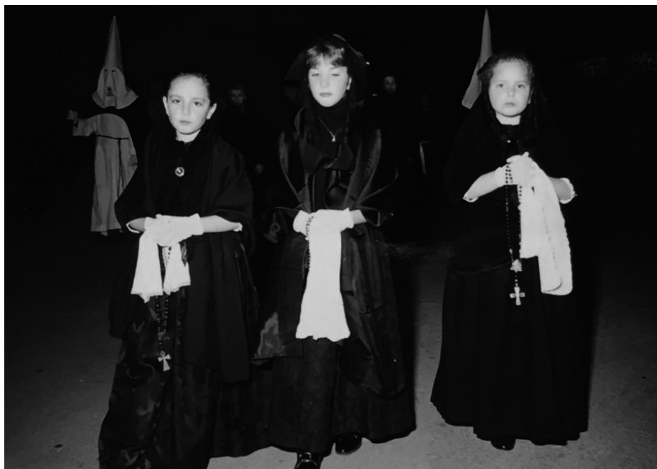
Fig. 6. Les tres Maries al Divendres Sant.

El diumenge de Pasqua també surten a la processó acompanyant la Mare de Déu, però en aquest cas van vestides de blanc. S'ha de tenir en compte que durant molts anys eren les mateixes nines les que sortien els dos dies, però, degut a la llarga llista d'espera, depenent de l'any surten diferents nines el divendres i el diumenge. A més, dins Inca hi ha famílies comptades que tinguin els vestits originals de Maria, les quals presten tant el vestit com les joies.