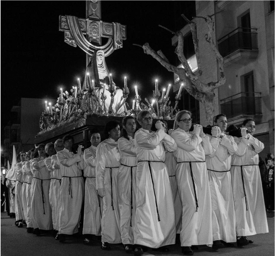
Fig. 9. La Dolorosa portada per dones.

No fou fins a l'any 1985 que les dones van poder sortir en processó, i amb aquest permís es produí un gran auge de la Setmana Santa, ja que va augmentar considerablement la participació de confreres dins les processons de la Setmana Santa. Fou la Confraria de Sant Tomàs la primera a incorporar l'any 2001 una colla únicament de dones per portar la imatge de la Dolorosa. Com a curiositat s'ha de destacar que la primera vegada que el Sant Crist d'Inca fou portat per dones fou per la colla de dones portadores de la Dolorosa. Això fou el dia de la processó que es va celebrar el dia 29 de setembre de 2007, en què es commemorava el 400è aniversari de la Suor del Sant Crist.