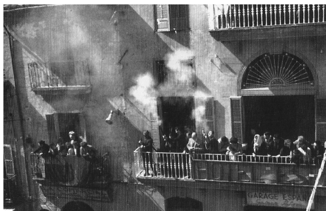
Fig. 8. Els escopeters.

que la gent que té balcons als carrers per on passa la processó els cedeixin i els engalanin amb domassos. S'ha de tenir en compte que els escopeters no depenen de cap organisme ni associació i que són una part essencial del diumenge de Pasqua que s'ha