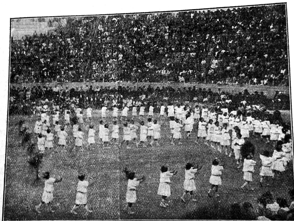
FESTA ESCOLAR—NINES QUE FAN GIMNASIA RÍTMICA