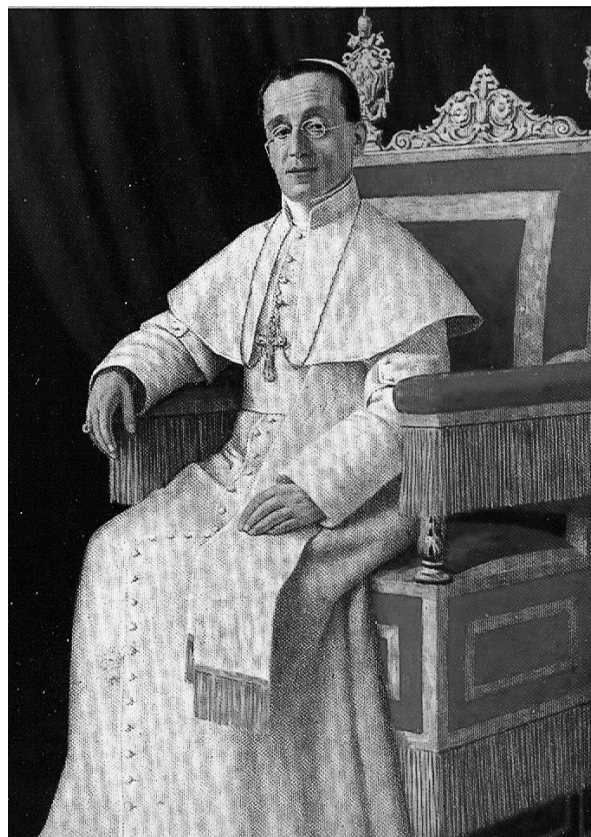
Figura 4. Postal del papa Benet XV