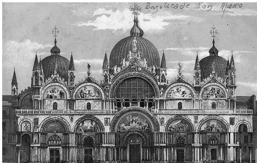
Figura 2. Postal de la basílica de Sant Marc

L'àlbum que acompanya les plaguets inclou més de 300 postals, de les quals aquí hem fet una petita selecció.