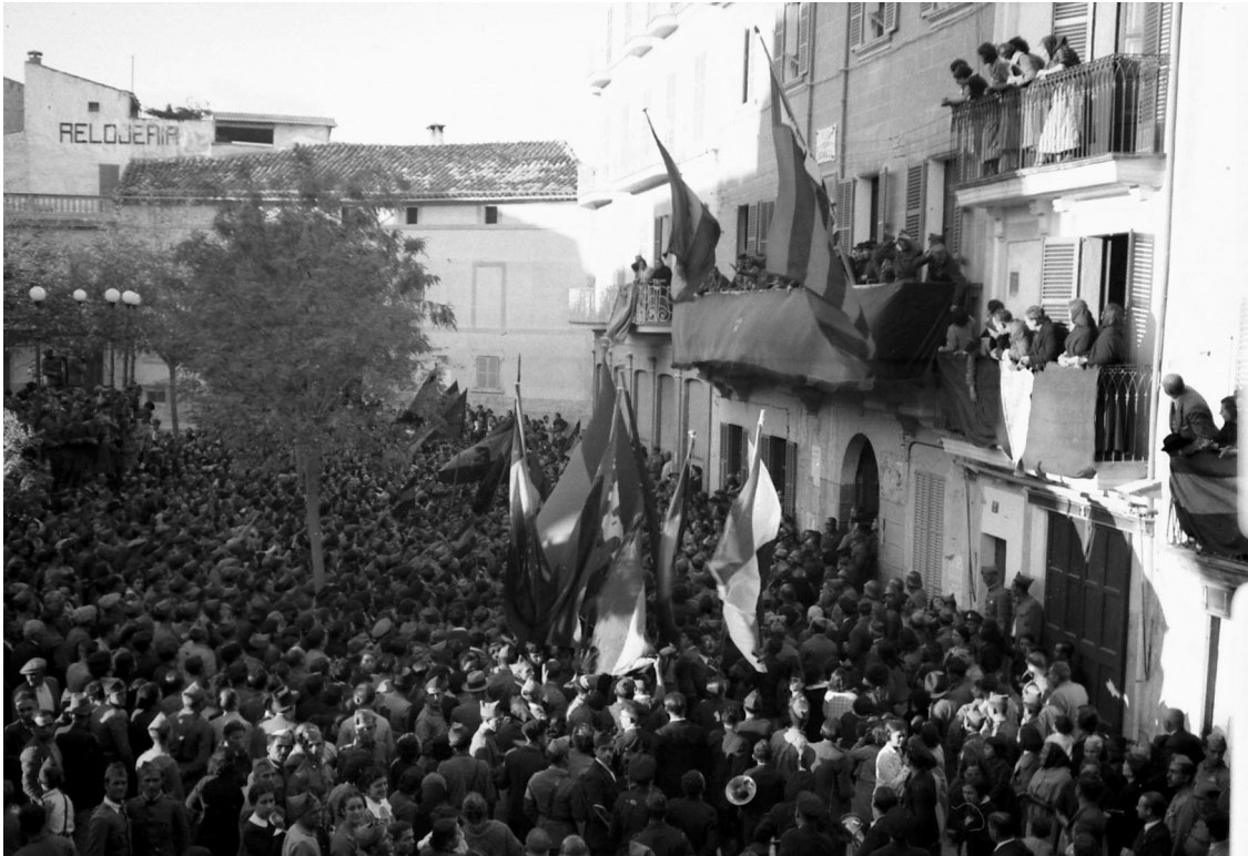
Figura 6. Concentració a la plaça de l'Ajuntament al 1936