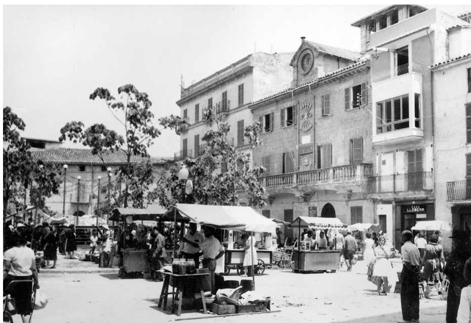
Figura 2. Mercat "del dijous" a Inca

La fotografia arribà a Mallorca el 1839, en concret a Palma. 9 Malgrat aquesta arribada primerenca de l'invent, la fotografia s'establí en el conjunt de l'illa d'una forma molt desigual, això és degut que aquesta va lligada als valors de la urbanitat. Aleshores Palma era l'únic nucli que presentava aquestes característiques i es convertí, per tant, en una ciutat que monopolitzava la localització dels establiments de fotografia. A pesar de trobar els estudis dels fotògrafs concentrats únicament a Palma, l'activitat fotogràfica es desenvolupava a la resta de l'illa gràcies al caràcter ambulat que presentaven alguns fotògrafs o bé dels treballadors del seu estudi, podem destacar els germans Sellarès. 10