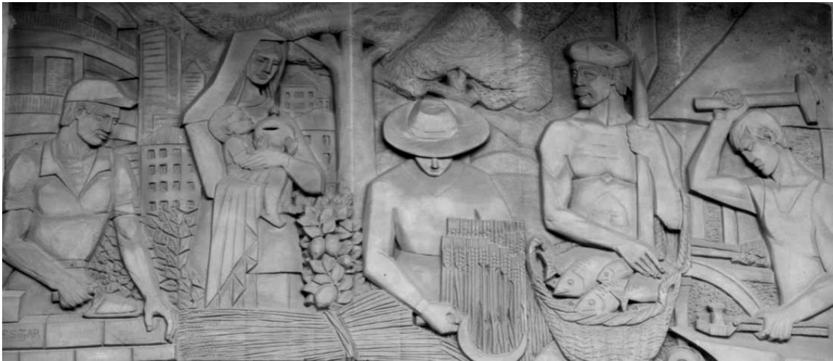
Figura 1. Relleu al treball, F. Sitjar

El desconeixement, la falta de previsió o la ignorància han donat lloc a algunes pèrdues patrimonial ocorregudes a Inca en el camp escultòric, especialment al llarg del segle XX, com per exemple la retirada del monument al pare Serra, que estava situat al davant del convent de Sant Francesc. En altres casos les pèrdues no han estat tan dràstiques i han suposat supressions o canvis d'alguns elements originaris de les escultures. Entenem que cal una reflexió en aquest sentit i que un fet d'aquestes característiques no pot repetir-se.