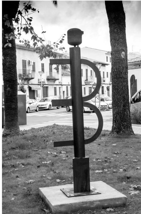
Figura 8. Exemple d'escultura sense cartel·la