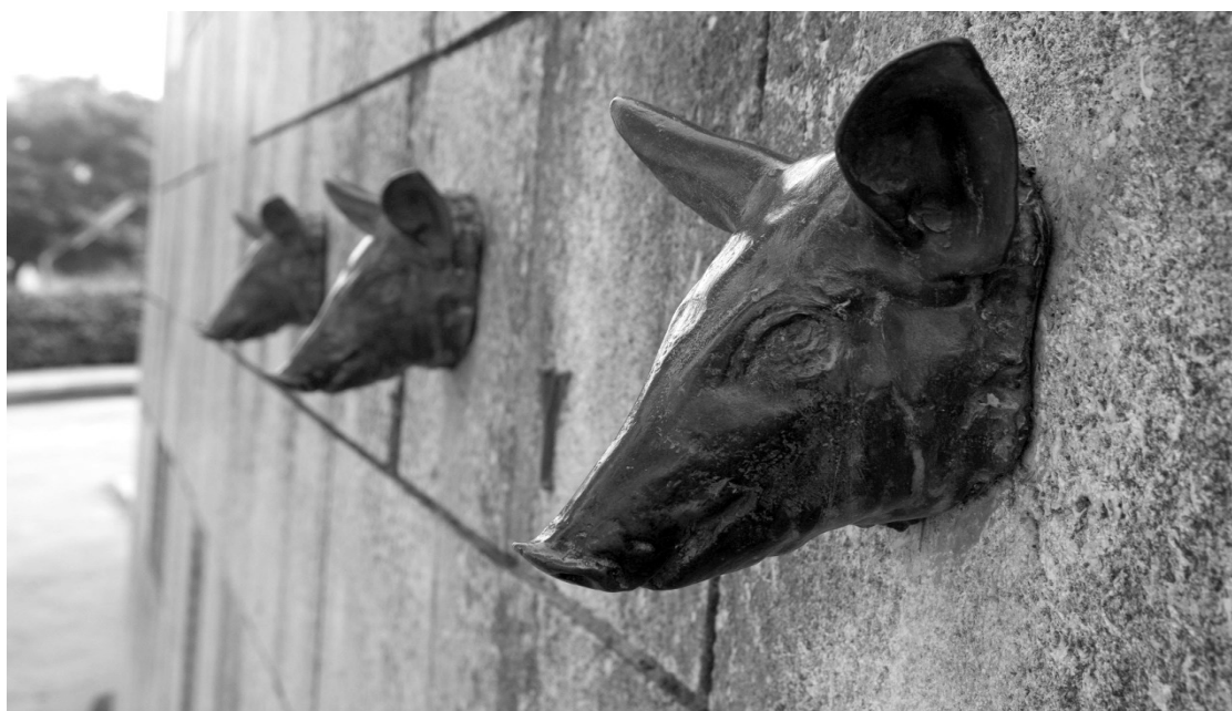
Figura 10. Els tres porquets XYZ