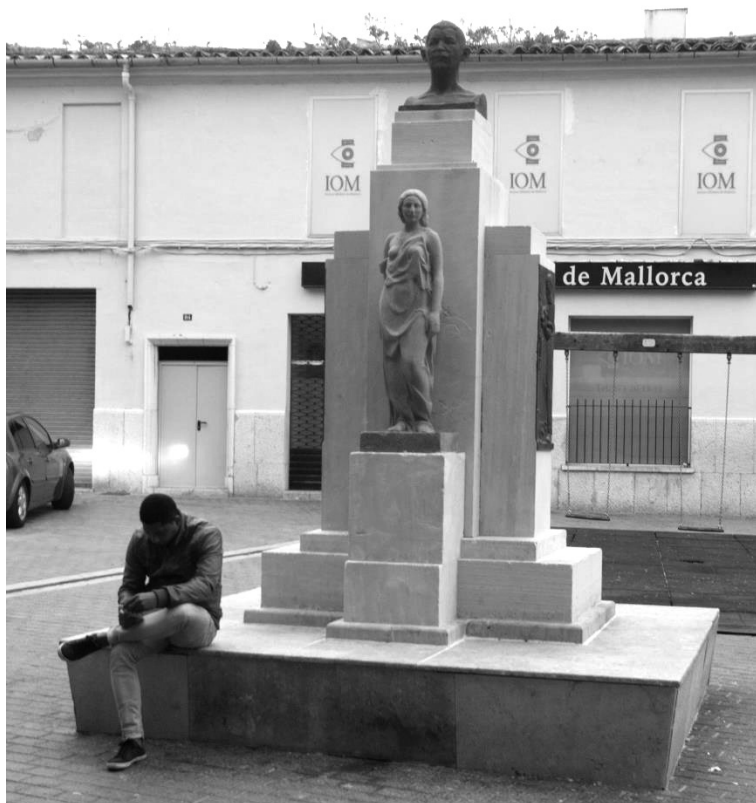
Figura 3. Monument a Antoni Fluxà

Al mateix temps l'escultura urbana inquera, seguint la tònica de tot l'Estat espanyol i influenciada sobretot per Catalunya, comença a mutar cap a un major pes del monument de promoció pública. Aquest canvi coincideix amb un auge del monument en tot el territori nacional.