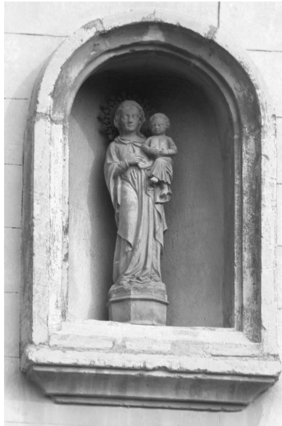
Figura 4. Capelleta del carrer de la Pau

(1923). Així i tot, gairebé tots els que hi ha a la nostra ciutat tenen una funció primordialment ornamental, per tant, es troben subordinats a l'arquitectura de la qual participen.