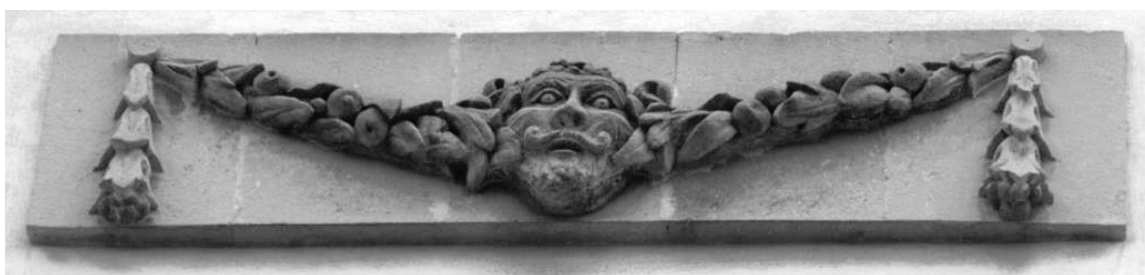
Figura 9. Detall de la façana del Teatre Principal

Malgrat comptar amb el Catàleg municipal de patrimoni com a principal eina reguladora de la protecció i la gestió del patrimoni escultòric de la ciutat, manca encara un retorn d'aquest cap a la ciutadania. En aquest sentit són necessàries estratègies que ajudin a conèixer-lo i difondre'l. Cal destacar la necessitat d'una correcta senyalització –ja que moltes no tenen cartel·la– o bé la realització d'un itinerari o ruta.