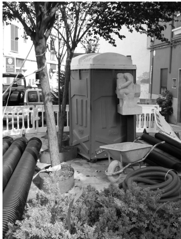
Figura 7. Rezicklaje , de Gabriel Figuerido

També val a dir que algunes de les escultures que trobem a la nostra ciutat requereixen d'una zona de respecte que no es dona. Tal és el cas del Monument a Antoni Fluxà , on no s'especifica l'àrea de respecte a la seva corresponent fitxa de Catàleg; o els casos de Dona de Diego Villamediana, que es troba rodejada de mobiliari urbà, i Rezicklaje (2011), envoltada de material d'obra, circumstàncies que limiten l'accés a les peces. Cal advertir que un mal emplaçament de les peces dificulta la interacció efectiva d'aquestes amb el públic. A més, resulta comú trobar casos en què el cablejat elèctric o altres elements logístics se superposen sobre les escultures de les façanes. El relleu del treball situat entre els carrers de la Murta i Jaume Armengol es troba encaixat al costat de dos aparells d'aire condicionat, o les decoracions de la façana de Can Ramis (1923), que estan cobertes de cablejat.