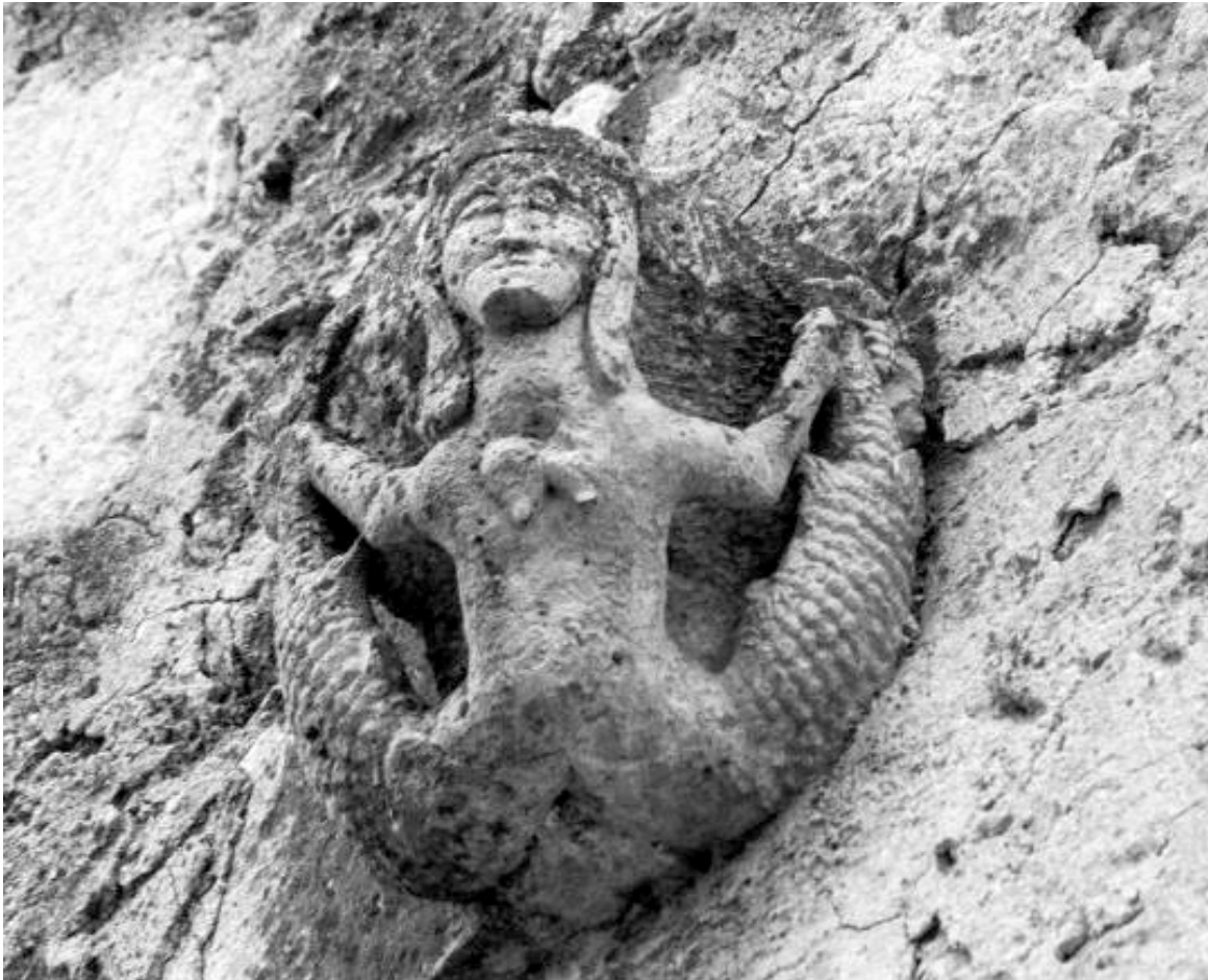
Figura 2. Sirena. Autor desconegut.

Al segle XVIII segueixen les aportacions a la nostra escultura urbana local. Conservem tota una sèrie d'obres d'aquesta època. Entre elles la Verge de la capelleta del carrer de la Campana. Si bé aquesta no es trobava a la fornícula actual, l'escultura data d'aquest segle. El mateix podem dir de la capelleta de la Mare de Déu del carrer de la Pau. A més, entre d'altres aportacions s'acaba l'obra del convent de St. Domingo (1730) 20 i es reconstrueix una nova església al monestir de St. Bartomeu (1702) 21 .