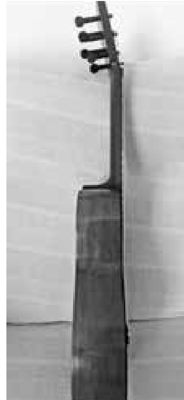
Figura 3. Vores, pal i claviller amb les clavilles