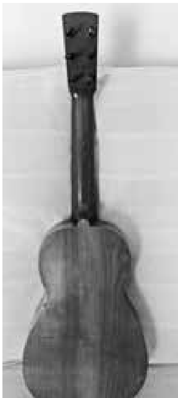
Figura 4. Fons, pal i cap