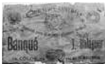
Figura 6. Etiqueta BANQUÉ de J. Balaguer