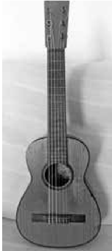
Figura 2. Guitarra Antigua Casa Banqué, caixa, pont, boca i diapasó (aprox. 1910)