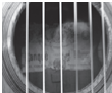
Figura 5. Senefa