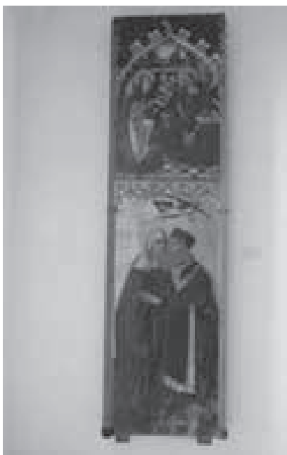
Fig. 4. Sant Joaquim i santa Anna, i l'Anunciació

A l'àtic de la taula es representa el Naixement de l'Infant Jesús, que té lloc a l'exterior. Al fons de la composició, hi destaca la representació d'una arquitectura en estat ruïnós formada per una casa i per algunes arcades, mentre que a la dreta es deixa veure un paisatge. A més dels personatges propis d'aquesta escena, Josep, Maria i l'Infant, també apareixen representats tres àngels que adoren el Fill de Déu. Una vegada més cal ressaltar l'intens cromatisme i la riquesa i tractament de les robes dels personatges, excepte el Nounat, que apareix nuu i recolzat sobre el mantell de la Verge.