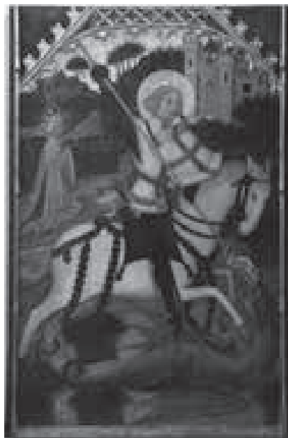
Fig. 3. Sant Jordi i el drac

La taula de Sant Jordi és una obra atribuïda a Francesc Comes, que prové del convent de Sant