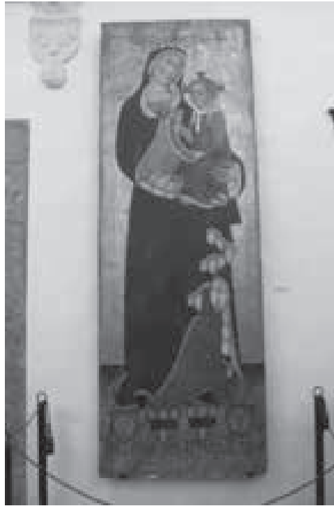
Fig. 1. Santa Maria d'Inca

Cal tenir en compte que la devoció més important del cristianisme i que destaca per damunt d'altres és la referida a la Mare de Déu. Per això mateix la seva representació sol ser molt nombrosa i en el cas de la pintura. Maria se sol representar estant dempeus o també asseguda en un tron i, en ambdós casos, apareix sempre sostenint l'Infant Jesús en braços. En aquesta taula ens trobam, doncs, davant el primer tipus de representació, el de la Mare de Déu dreta i el Nin Jesús als seus braços.