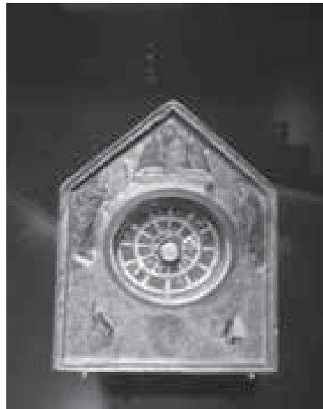
Fig. 7. Reliquiari del Baró de Dolors (Arxiu Guillem Reus)