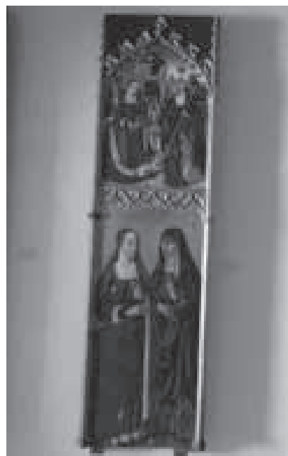
Fig. 5. La Visitació i el Naixement de Jesús