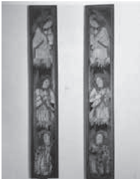
Fig. 6. Àngels adoradors

Els principals trets de la pintura flamenca en aquesta obra se situen al tractament dels plecs i també a la viva paleta cromàtica, elements que ajuden a consignar la seva datació.