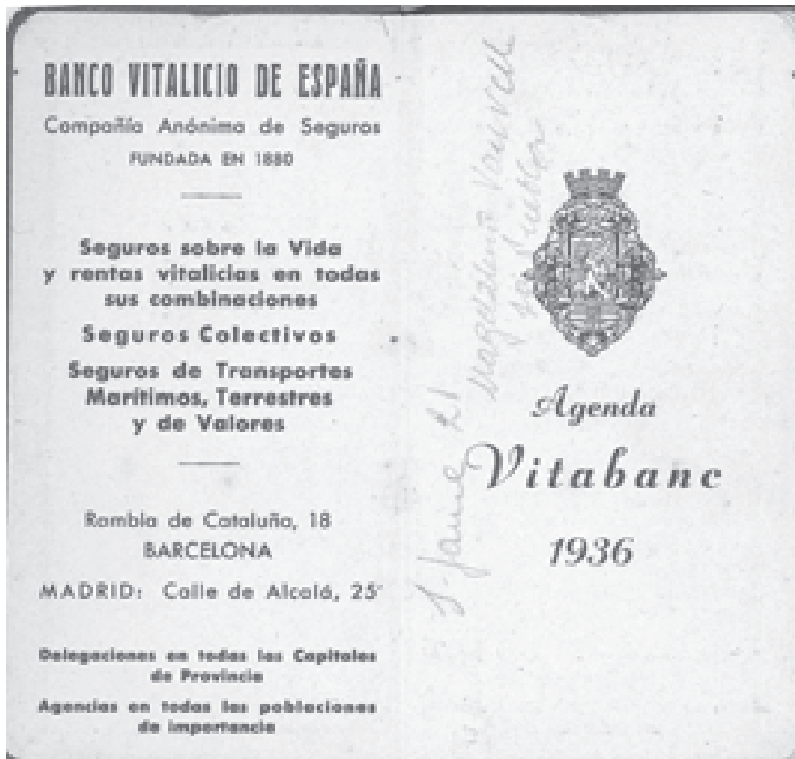
Figura 1. Pàgines inicials de l'agenda d'Antoni Mateu