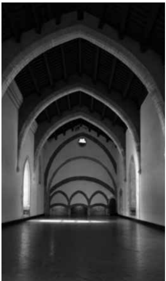
Fig. 20. Sala de Mallorca de Perpinyà

arquitectura gòtica mediterrànea” i que ens és útil per aclarir l'origen i el desenvolupament d'aquest tipus arquitectònic. Mira observa que és important tenir en compte que l'arquitectura gòtica que es dona a la Corona d'Aragó entre els segles XIII, XIV i una part del XV és una arquitectura semblant a aquella que també es realitza al Llenguadoc i a la Provença. Aquest fet és a causa de les relacions que han existit des de temps enrere entre aquests territoris. No podem oblidar que el rei En Jaume va nàixer el 2 de febrer de 1208 a la ciutat de Montpeller i que per altra banda, entre els anys 1112 i 1285, el Casal de Barcelona fou titular del comtat de Provença. Tot i això, també els regnes de València i de Mallorca mantingueren fortes relacions amb la Provença. Un altre apunt que fa Mira es refereix a les similituds i coincidències que existeixen entre l'arquitectura gòtica del regne privatiu de Mallorca i el sud d'Itàlia, Sicília, Sardenya i també amb l'arquitectura gòtica de Xipre i Rodès. 22