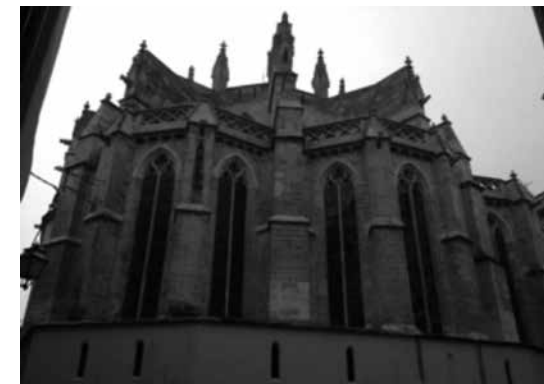
Fig. 7. Absis de l'església de Santa Eulàlia de Ciutat

Aquestes esglésies segueixen el mateix model arquitectònic que les anomenades de repoblació, però es diferencien d'aquelles per les seves dimensions, que són molts superiors. Estan constituïdes per una planta rectangular dividida en trams mitjançant arcs diafragmes ogivals i poden o no tenir capelles laterals situades entre els contraforts. A Mallorca tan sols se'n coneixen dos exemples i estan situats a Ciutat. Un seria el que constituï el primer convent franciscà de la capital, l'actual església de Santa Margalida (fig. 5). L'altre exemple seria la segona església aixecada pels franciscans, conservada