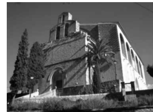
Fig. 11. Església de Sant Llorenç de Selva

D'aquesta segona església, en sabem que seguia la segona tipologia gòtica pròpia de les parròquies aixecades a partir del segle XIV. Així doncs, sabem que el nou temple era de planta basilical d'una sola nau i que tenia capelles entre els contraforts. El que no tenim documentat és com era el cobriment de l'església. Per tant, no sabem si el temple estava cobert per un enteixinat de fusta a dues vessants sustentat per arcs gòtics diafragmes o bé si pertanyia a la tipologia d'esglésies cobertes amb volta de creueria de pedra. Malgrat que no disposam de documentació per afirmar com era aquest temple, cal tenir en compte altres exemples de pobles mallorquins, com Santanyí, Capdepera o Selva (fig. 10). L'antiga església de Sant Andreu de Santanyí, coneguda a dia d'avui com església del Roser, és un exemple d'església parroquial del segle XIV que constitueix un important model per saber com era la tipologia de les parroquials que s'aixecaren a partir del 1300. Tot i que a Santanyí el temple gòtic no té capelles laterals, sí que s'hi observa una coberta de pedra de volta de creueria. Aquest