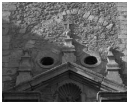
Fig. 13. Arc ogival a Santa Maria la Major d'Inca

A l'interior del temple, concretament a la capella de Sant Blai (fig. 12), hi va aparèixer un arc ogival que comunica aquesta capella amb la del Cor de Jesús. A més, damunt el portal lateral o dels homes (fig. 13), a la façana exterior, també hi va aparèixer un arc ogival cegat. Tot i això, aquest darrer arc sembla que podria ser també un arc de descàrrega. El fet que no s'hagin dut a terme estudis respecte a això ens obliga a tractar el tema de forma hipotètica sense poder assegurar si les dues restes formarien part de l'església medieval del segle XIV.