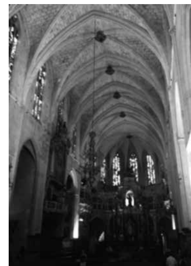
Fig. 6. Basílica de Sant Francesc de Ciutat

actualment a la plaça de Sant Francesc, però en el segle XIV se li substituï l'enteixinat de fusta per una coberta de pedra de volta de creueria.