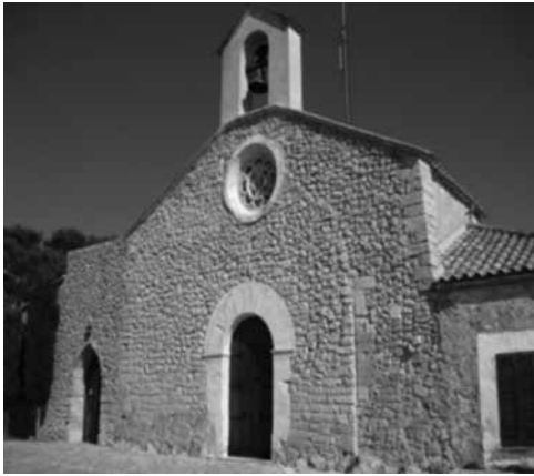
Fig. 19. Façana de Santa Magdalena del puig d'Inca

arquitectura gòtica mediterrànea” i que ens és útil per aclarir l'origen i el desenvolupament d'aquest tipus arquitectònic. Mira observa que és important tenir en compte que l'arquitectura gòtica que es dona a la Corona d'Aragó entre els segles XIII, XIV i una part del XV és una arquitectura semblant a aquella que també es realitza al Llenguadoc i a la Provença. Aquest fet és a causa de les relacions que han existit des de temps enrere entre aquests territoris. No podem oblidar que el rei En Jaume va nàixer el 2 de febrer de 1208 a la ciutat de Montpeller i que per altra banda, entre els anys 1112 i 1285, el Casal de Barcelona fou titular del comtat de Provença. Tot i això, també els regnes de València i de Mallorca mantingueren fortes relacions amb la Provença. Un altre apunt que fa Mira es refereix a les similituds i coincidències que existeixen entre l'arquitectura gòtica del regne privatiu de Mallorca i el sud d'Itàlia, Sicília, Sardenya i també amb l'arquitectura gòtica de Xipre i Rodès. 22