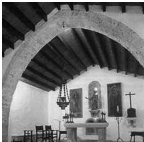
Fig. 4. Església de Sant Pere d'Escorca

A aquest tipus d'arquitectura varen pertànyer aquelles primeres parròquies que ja s'esmentaren a la butlla Cum a nobis petitur que el papa Innocenci IV signà a Lió el 14 d'abril de 1248. Però, d'aquestes primeres parròquies, sols les situades a la Part Forana varen pertànyer a la tipologia esmentada. Tenint en compte els estudis que s'han publicat referits a aquesta qüestió, sembla que l'església de Sant Pere, conservada al municipi d'Escorca (fig. 4), seria l'exemple més original que es conservaria i que hauria sofert manco modificacions al llarg dels segles. Tot i això, i malgrat que en d'altres de les esglésies de repoblació que es conserven a Mallorca hagin estat modificades o, fins i tot, moltes vegades, ampliades, sempre han conservat aquella tipologia primitiva. Això és una planta rectangular dividida per un arc diafragma o més que aguanten un enteixinat de fusta a dos vessants, amb poques i petites finestres, portal d'arc de mig punt i un campanar de paret, conegut també com espadanya.