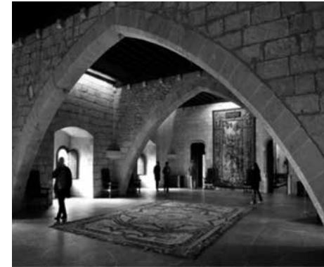
Fig. 21: Sala del Tinell de l'Almudaina de Ciutat

Per tant, dit això, podem afirmar, tal com exposa Arturo Zaragozá Catalán, que l'origen del sistema de l'arquitectura d'arcs diafragmes es troba en una província de l'Imperi romà i que s'allargà fins al final de l'edat mitjana. L'ús d'arcs diafragmes es donà per primera vegada a Síria, i aquest sistema arquitectònic ja era utilitzat allà a cases, palaus i temples. Fou, per tant, des de Síria que aquesta “manera de fer” es va estendre a altres territoris de la Mediterrània oriental (Jordània, en algunes illes gregues, a Xipre, a Creta i a alguns llocs de l'Àtica). Seguidament arribà a la Mediterrània central, concretament a llocs com Sicília i Malta i, per acabar, arribà a final del segle XII a la Mediterrània occidental (Itàlia, Llenguadoc i la Corona d'Aragó). En aquests darrers territoris, l'ús que es féu del referit tipus d'arquitectura s'allargà durant els dos segles següents. En el cas del Regne de Mallorca, aquest fou el sistema que se seguí per construir les primeres parròquies tot just després del 1229. Aquest mateix sistema s'utilitzà durant els segles XIV i XV per a la construcció d'altres esglésies rurals i també fou emprat a les sales dels palaus reials, com són els casos de la Sala