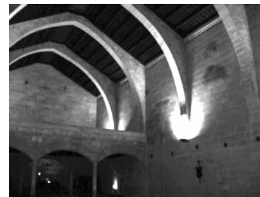
Fig. 5. Església de Santa Margalida de Ciutat

actualment a la plaça de Sant Francesc, però en el segle XIV se li substituï l'enteixinat de fusta per una coberta de pedra de volta de creueria.