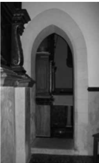
Fig. 12. Portal ogival a Santa Maria d'Inca

Com ja hem dit, de la primera església aixecada al segle XIII, tot just després de la conquesta catalana, res ens ha arribat i del segon temple del segle XIV, sembla que tampoc. Tot i això, cal esmentar dos arcs ogivals que varen aparèixer durant la darrera reforma que es va dur a terme al temple actual datat del segle XVIII.