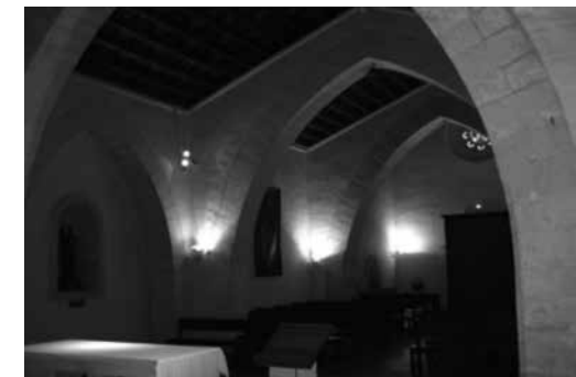
Fig. 18. Interior de Santa Magdalena del puig d'Inca

Així doncs, atès el mal estat de l'edifici es començaren unes obres de restauració l'any 1885, que duraren fins al 1900. Durant aquests cinc anys, es dugué a terme la substitució de l'antic enteixinat mudèjar del segle XIV; encara que algunes bigues es conservaren a la sagristia, sembla que actualment no en queda cap. Durant aquesta restauració, també es taparen les dates de 1530 i 1574 que se situaven damunt els arcs quan aquests foren reconstruïts en el segle XVI. Més endavant, ja durant el segle XX es rebaixà el paviment del temple i es retallaren els arcs diafragmes en forma de xamfrà. A més a més, es retirà el cor que estava situat als peus de l'oratori i l'arc rebaixat fou substituït per un