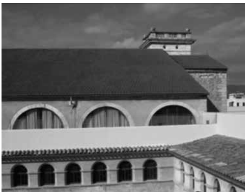
Fig. 24. Galeria de la façana dreta de l'església de Sant Francesc

glésia, cal esmentar les esglésies conventuals de Perpinyà, capital del Regne de Mallorca a l'època de la construcció de l'església de Sant Francesc d'Inca, i que segueixen en gran part aquesta mateixa tipologia arquitectònica. En són exemples les esglésies de Sant Domènec, la Real (al segle XIX, l'embigat fou substituït per una falsa volta de creueria feta de guix), Nostra Senyora del Carme o Sant Francesc (desapareguda), totes construïdes durant el segle XIV (fig. 23).