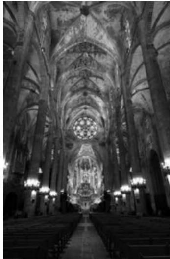
Fig. 8. Interior de la Seu de Mallorca

que fou fundada l'any 1230, 3 i a l'any 1236 apareix documentada en el paborde de Tarragona; 4 per tant, parlariem d'un edifici que fou bastit durant el segle XIII, tot just després de l'arribada a l'illa del rei En Jaume. També cal tenir en compte que fou en aquesta mateixa església on el futur Jaume II de Mallorca jurà els privilegis i les franqueses del Regne de Mallorca l'any 1256 i fou coronat rei el 1276.