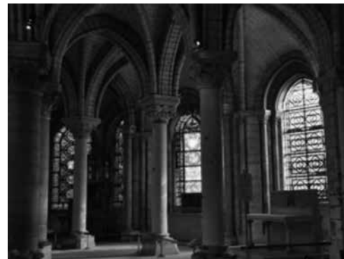
Fig. 3. Basilique de Saint-Denis, París

l'església de Saint-Martin-des-Champs i a l'abadia de Saint-Denis, també és cert que són dos edificis religiosos que ja en un primer moment es desmarcaren de l'estil romànic. Així, l'abadia de Notre-Dame de Morienvil es començà a construir al segle XI, però és a partir de l'any 1125 quan trobam ja l'ús de la volta ogival per cobrir l'edifici. En el cas de l'abadia de Saint-Germer-de-Fly, es tracta d'una església fundada al segle VII. L'actual abacial fou construïda entre 1135 i 1206 en estil gòtic primitiu. Per això està considerada com un exemple característic de l'estil protogòtic i constitueix un dels testimonis més antics de l'art gòtic francès.