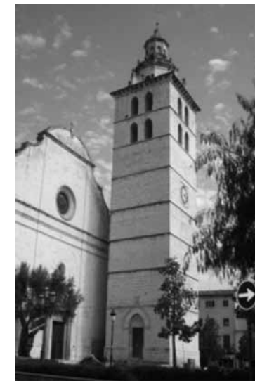
Fig. 14. Campanar de Santa Maria la Major d'Inca

Un altre aspecte interessant és la tipologia de la planta de l'actual temple barroc. Es tracta d'una planta basilical amb set capelles a cada lateral, situades entre els contraforts. Aquesta és una tipologia de tradició gòtica, que fou emprada a partir del segle XIV i que ha perviscut al llarg del temps fins als nostres dies. Passa el mateix amb les galeries situades a les façanes laterals del temple. A la façana lateral dreta s'hi obren cinc arcades de mig punt, mentre que a la façana lateral esquerra se n'obren també cinc, però els arcs són ogivals. Aquestes galeries constitueixen una pervivència del gòtic tardà, les quals es donen a Mallorca a les esglésies que es construïren a partir del segle XVI, model que pervisqué fins ben entrat el segle XIX a la parroquial de Sant Julià de Campos.