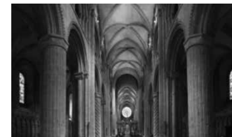
Fig. 1. Catedral de Durham, Anglaterra

El terme gòtic fou creat en una època molt posterior al naixement d'aquest estil. Fou Giorgio Vasari, en el segle XVI, qui es referí a l'art de l'època medieval com un art propi de la barbàrie. Així mateix, aquest art també fou considerat bàrbar durant el segle XVII. 1