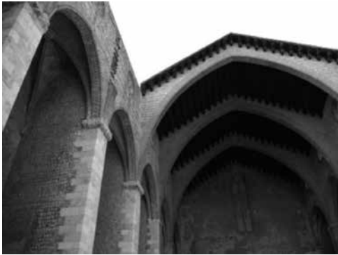
Fig. 23. Església de Nostra Senyora del Carme de Perpinyà