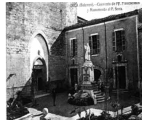
Fig. 22. Antic portal medieval de Sant Francesc d'Inca

de Mallorca del Palau dels Reis de Mallorca de Perpinyà (fig. 20), o el cas de la Sala Major del Palau de l'Almudaina a Ciutat de Mallorca (fig. 21). 23