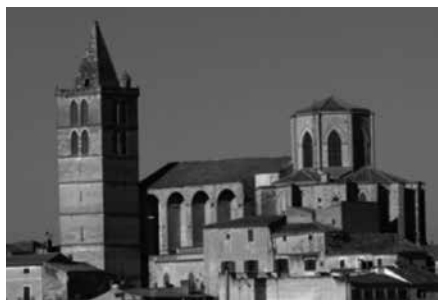
Fig. 9. Església de Santa Maria de Sineu

Així doncs, aquests temples segueixen també una planta rectangular dividida per diferents trams amb capelles entre els contraforts i amb coberta de pedra de volta de creueria. A l'interior, damunt les capelles, també s'hi obrin finestres ogivals, però els nervis de la creueria descansen damunt mitges columnes acabades moltes vegades per un capitell de factura clàssica, en la majoria de casos d'ordre jònic. Una característica d'aquesta arquitectura gòtica tardana és que a l'exterior, a les façanes laterals, els contraforts apareixen coberts per una teulada i oberts entre ells a l'exterior mitjançant arcs, normalment de mig punt (en alguns casos també poden ser ogivals o escarsers), formant així una llotja o galeria.