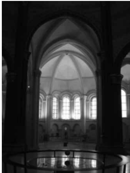
Fig. 2. Saint-Martin-des-Champs, París

tot certa, perquè l'església no fou erigida seu episcopal fins al 1966. Juntament amb aquestes dues construccions, també s'han de destacar dos edificis religiosos més: les abadies de Notre-Dame de Morienvil i de Saint-Germer-de-Fly, edificis que en la seva arquitectura ja presenten alguns trets gòtics. Si bé és cert que són dues construccions anteriors a