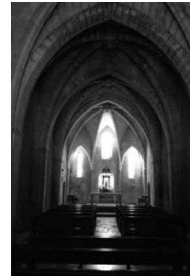
Fig. 10. Església del Roser de Santanyí

Gràcies a una làpida sepulcral del prevere Guillem Sabadell, sabem que ja el 1329 aquesta segona església gòtica ja estava acabada. Dita làpida encara es conserva actualment fixada al mur dels peus del temple actual.