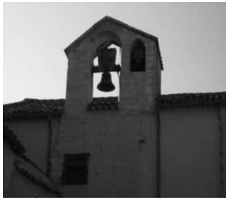
Fig. 15. Espadanya de Sant Bartomeu d'Inca

L'església de Sant Bartomeu fou el segon temple que s'aixecà en època medieval damunt el puig d'Almadrava d'Inca. La primera referència que en tenim és de 1250, que apareix com a referència toponímica: "puig de Sant Bartomeu d'Almadraba". 12