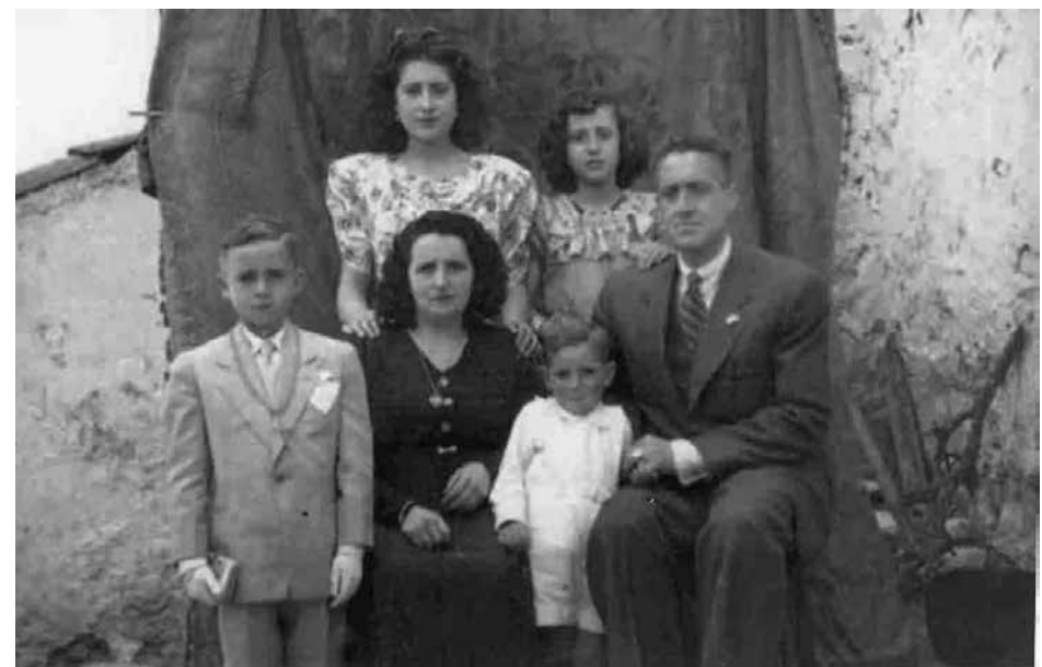
A l'esquerra de la imatge, vestit de primera comunió