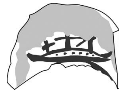
Figura 1. Teula pintada on es representa un vaixell, que forma part del conjunt localitzat a Inca