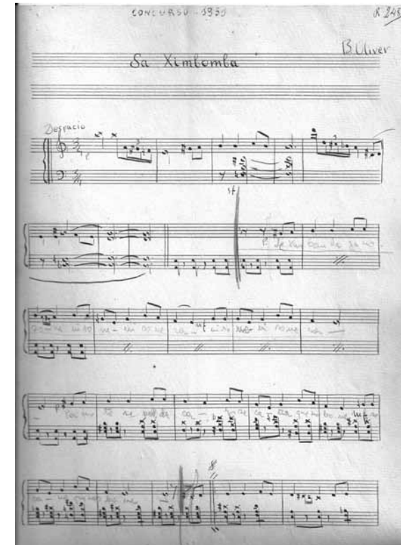
Figura 1. Partitura Sa Ximbomba, Concurso 1951

La partitura per a piano de "Sa Ximbomba" amb la qual Oliver va participar en el III Concurs "Se Ximbomba d'Inca" el 1951. En aquesta ocasió la part vocal va ser a càrrec del senyor Gabriel Mateu Mairata (Selva, 1912 – Campanet, 1989). Aquesta petita obra per a piano és interessant perquè, a més de mostrar l'interès del compositor per la música mallorquina més tradicional i d'especial arrelament a Inca, presenta una melodia que, recollida i transcrita pel mateix Oliver, difereix de les versions recollides per fra Joan Rubí i Barceló (1882-1961), 7 a Inca el 1909, que apareix editada en el Cançoner Musical de Mallorca de Josep Massot i Planes (1876-1943) 8 l'any 1984, i la Cançó de sa Ximbomba (c. 1950), escrita per a flauta, cant i baix pel mestre Bartomeu Calatayud i Cerdà (1882-1973), 9 (sense editar). Aquestes diferències confirmen les variants que