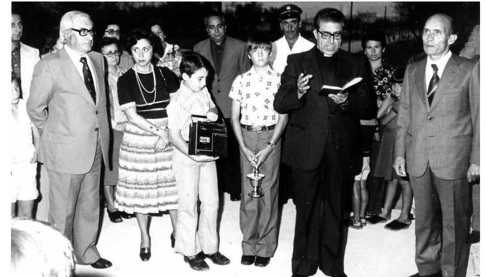
Figura 5. Foto de la inauguració del CP Ponent

A través d'un "concurssillo", 13 el 1977 passa al CNM Ponent, d'on serà el director fins a la seva jubilació l'agost de 1985.