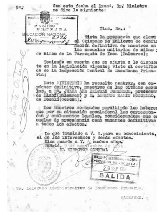
Figura 3. Nomenament definitiu com a mestre de l'Escola Parroquial

És anul·lada per ordre de la Dirección General de Enseñanza Primaria de 29 d'octubre de 1952. 9