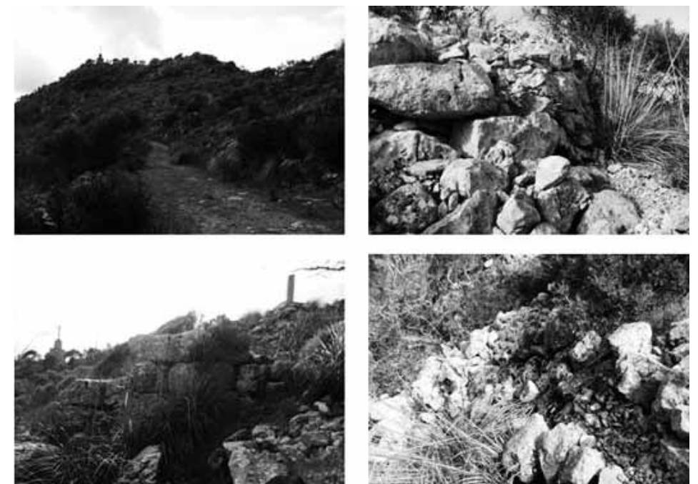
Figura 2. Estat actual del jaciment arqueològic del puig d'Inca (autora: M. Sastre)

L'estat actual de dit jaciment és molt dolent, atès que es troba totalment desaparegut a causa de la vegetació existent. Per altra banda, presenta gran part de les estructures en runes, i el fet que es trobi dalt d'un turonet fa que aquest enrunament sigui més intens i acceleri la seva desaparició.