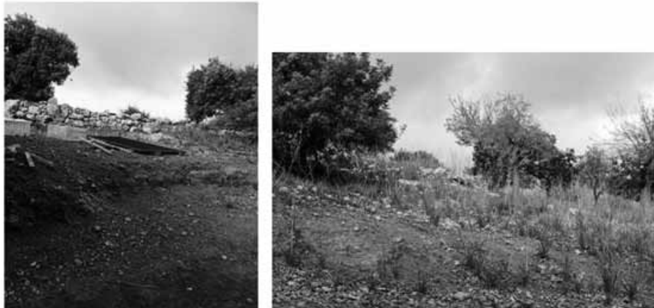
Figura 1. Estat actual del jaciment del puig de ses Talaies

ra adequada (creació de discursos, visites guiades, tallers...). Resumint podem dir que només compleix un dels punts de la cadena valorativa i que, per tant, és un jaciment arqueològic que no està activat, no es pot explotar el bé arqueològic com un recurs econòmic i divulgatiu, i es troba exposat a la desaparició final.