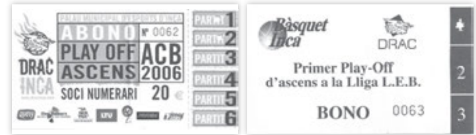
Figura 8. Abonaments de play-off d'ascens

Ja en el format de fase final de vuit equips, es va classificar per primera vegada la temporada 2000-01, després de quedar cinquè a la fase regular. L'eliminatòria amb el Granada es va perdre novament per 3-2. La temporada 05-06, després de quedar quart (millor classificació de la història del club), l'enfrontament a quarts de final amb el Buesa de Sant Sebastià va acabar 3-0, resultat que es repetiria l'any següent en la darrera participació de l'equip en uns play-off d'ascens a l'ACB contra el CAI Zaragoza; l'equip es classificà en sisena posició.