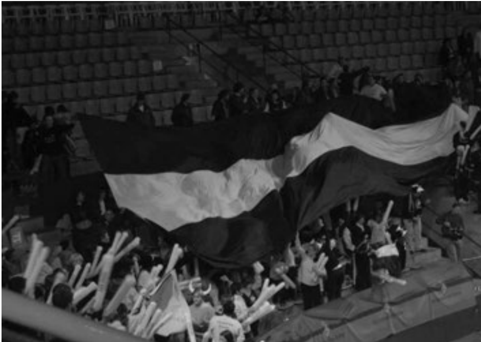
Figura 5. L'afició animant l'equip a la final de Copa de la temporada 2005-2006.