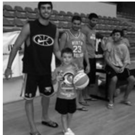
Figura 22. Els joves jugadors inquers tenen els seus referents esportius molt propers.

El període descrit en aquest treball representa només una part de la història del bàsquet inquer. A més, els moments aquí descrits referents a l'equip professional es poden completar amb l'anàlisi de la repercussió de l'equip en la pràctica de l'esport, sobretot entre els més petits. La projecció futura del bàsquet inquer s'ha de fer, per tant, no només des del punt de vista de l'esport professional, sinó tenint en compte també la penetració social de l'esport, ja sigui referent a la seva pràctica com també a l'afició que desperta. D'aquí es conclou l'existència d'una forta relació entre l'esport de la cistella i la ciutat d'Inca.