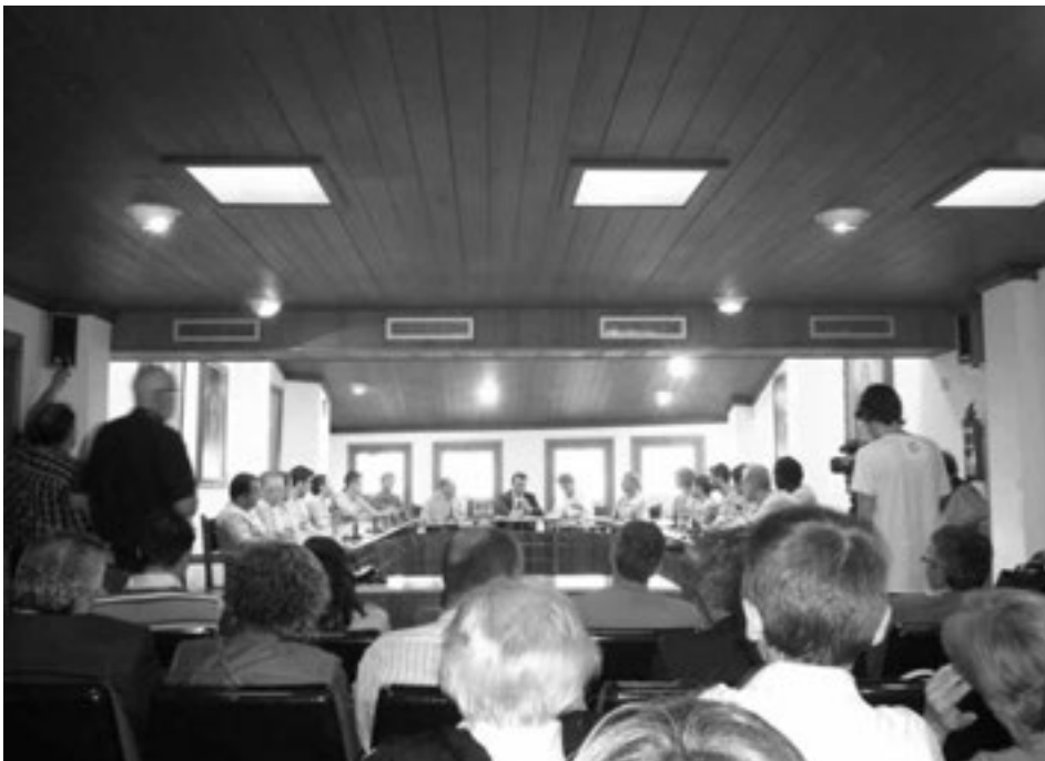
Figura 15: Recepció de la plantilla a l'ajuntament d'Inca.

L'afició va envair la pista per celebrar la recuperació de la categoria.