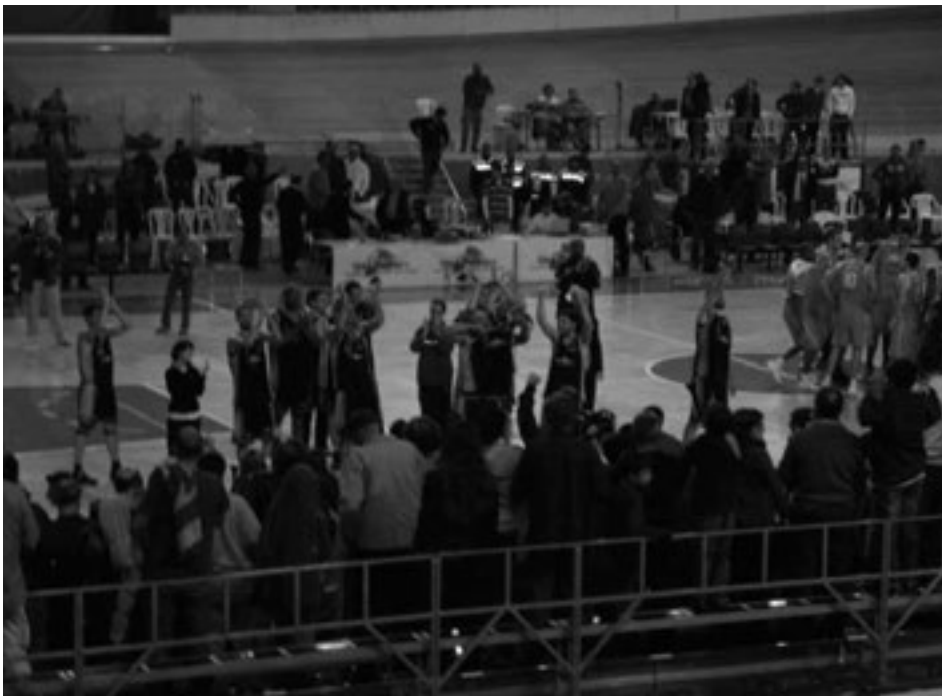
Figura 6. L'equip agraint el suport de l'afició en la semifinal de Copa de la temporada 2005-2006.

L'any 2003 la Copa es va disputar a Inca, i hi participaren el Bilbao, el Tenerife i el Menorca. En les semifinals l'equip basc va derrotar els inquers, mentre que el Tenerife va fer el mateix amb els menorquins. Al final la Copa va ser per al Tenerife, en uns dies en què a Inca es va respirar bàsquet i les aficions ompliren el Palau.