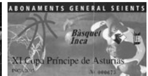
Figura 2. Subcampió de la Copa Príncep d'Astúries, any 1998.