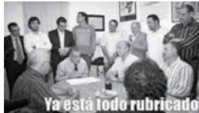
Figura 11. Moment de la creació del Club Bàsquet Mallorquí.

Durant diversos mesos es varen anar succeint una sèrie de negociacions vinculades al projecte de fusió entre l'Alcúdia, el Muro i l'Inca. Durant aquestes, a Inca es va produir una mobilització de suport per part de la massa social del Club, que va recollir més de 7.000 signatures sol·licitant que a Inca es continués gaudint de bàsquet.