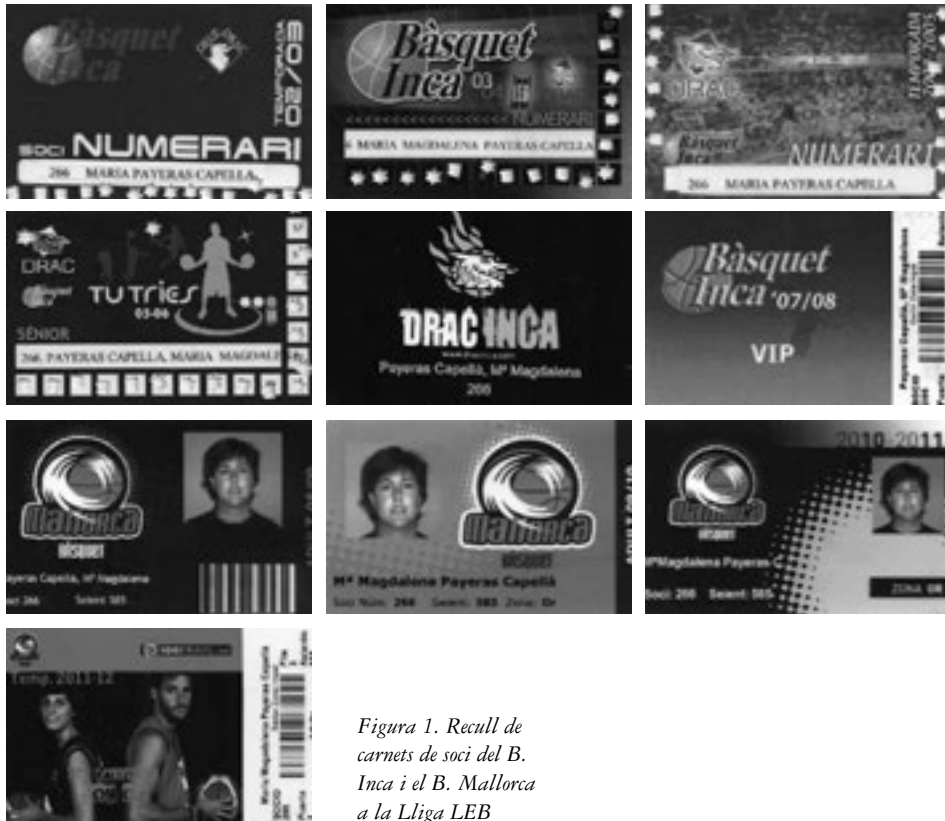
Figura 1. Recull de carnets de soci del B. Inca i el B. Mallorca a la Lliga LEB