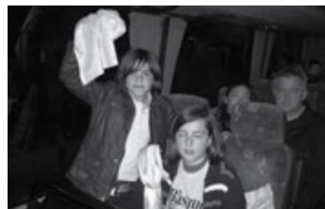
Figura 9. Aficionats desplaçant-se al Palma Arena.