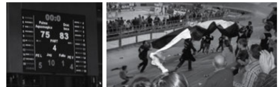
Figura 10. Celebració d'una victòria al Palma Arena i detall del marcador.

El mes de gener de 2008 la Conselleria d'Esports, atesa la precària situació econòmica dels representants del bàsquet mallorquí Inca i Palma (Club Bàsquet Alcúdia), de la LEB Or, i Muro, de la LEB Plata, va proposar la formació d'un sol equip resultant de la fusió dels tres, de manera