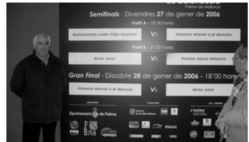
Figura 4. Cartell de la Copa de la temporada 2005-2006.