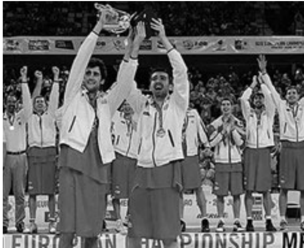
Figura 19. Campionat d'Europa Sub-20, any 2011.

Després de jugar al Melilla i al Cantabria a la LEB i tornar a l'ACB en les files del Murcia, va tornar a Inca la temporada 2007-2008 abans de tornar a l'ACB aquesta vegada amb el Lleó. Un autèntic rodamón del bàsquet espanyol.