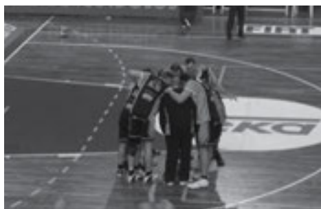
Figura 7. Equip de la temporada 2005-2006 abans d'un partit.