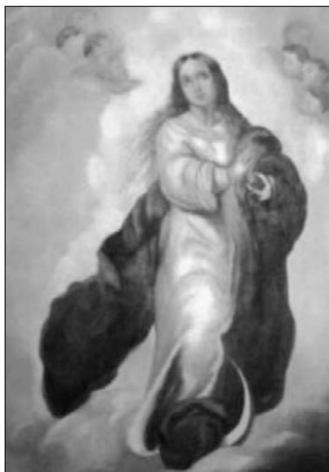
La Immaculada . 94 x 69 cm