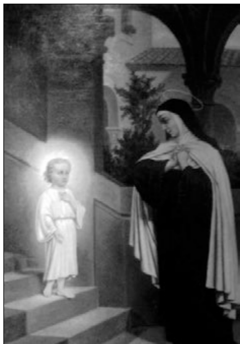
Santa Teresa del Niñ Jesús. 1903