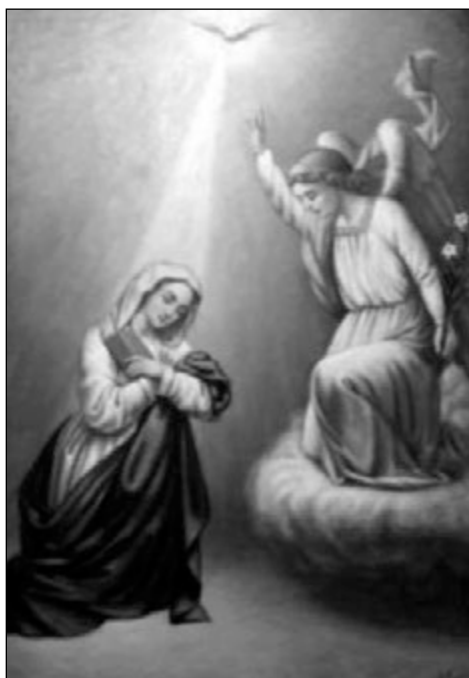
L'Anunciació . Any 1903, 102 x 78 cm