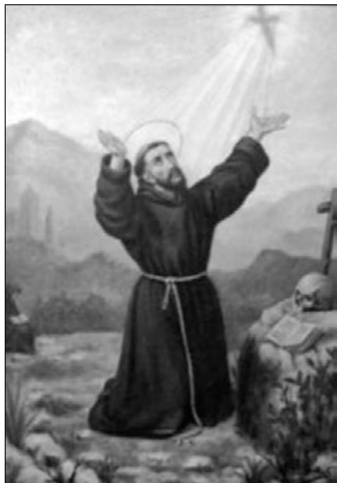
Sant Francesc d'Assís. 1908, 79 x 58 cm