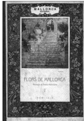
Portada del llibre Flors de Mallorca