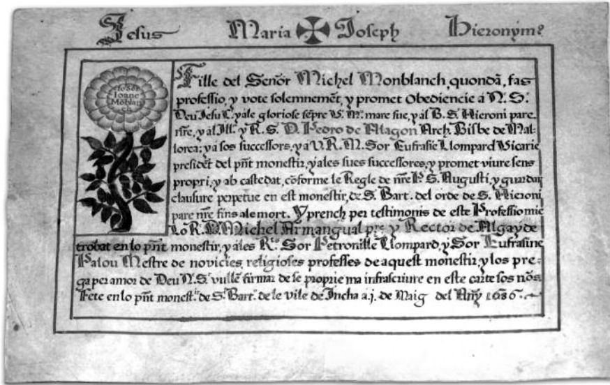
Carta de professió amb orla vegetal i el seu model d'orla tipogràfica