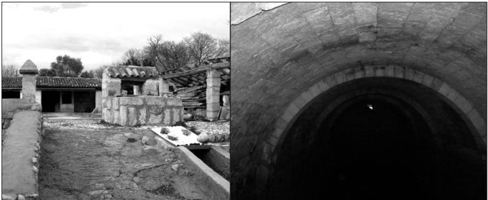
Imatges de l'exterior i de l'interior de l'aljub gran

Al seu extrem nord s'adossà una porxada que arriba fins al coll de l'aljub.