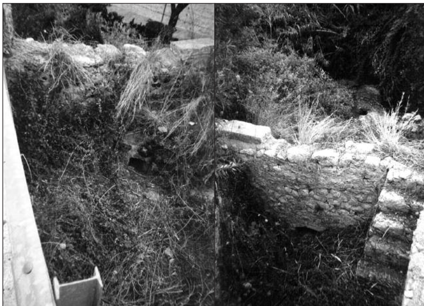
Imatges de la resclosa i de l'inici de la sèquia al Pont de Son Perellonet

Aquest tram de paret sud del torrent entre el pont i la paret de la finca veïna té 60 cm d'amplada i més de 2 m de llargada, per 1,80 m d'alçada aproximadament. Pel costat sud de la paret ja comença la sèquia, la qual comença a un espai triangular bastant ample delimitat pel pont, pel torrent i per la paret de la finca veïna. Aquest espai es va estrenyent durant 4,5 m, on a partir d'aquest punt la sèquia ja té una amplada regular de 0,5 m. Dins aquest espai triangular hi ha, adossada al pont, una escala d'obra que permetia baixar a dins la sèquia.