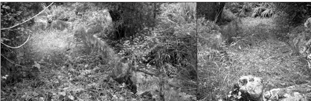
Dues vistes de l'estany del jardí

Com ja s'ha dit abans la síquia passava per davant la façana principal de les cases i delimitava la part del jardí compresa entre les cases i el camí de Son Vivot per la seva part de ponent. El camí que dona accés a les cases talla el jardí en dues parts; una, on hi havia els tarongers, l'aljub i part del jardí situada al nord; i l'altra, que és la més gran, situada al sud. En aquesta part del jardí, propera a la síquia, és on hi havia un estany decoratiu integrat dins el jardí romàntic del segle XIX. L'estany té forma irregular, semblant a un vuit, és a dir, dues basses el·líptiques unides per un canal estret. Aquest estany tenia un metre de profunditat aproximadament i les seves parets, rectes, estaven coronades per una tira de pedres decoratives, amb molts de forats, que sobresortien per sobre la làmina d'aigua marcant-ne els límits.