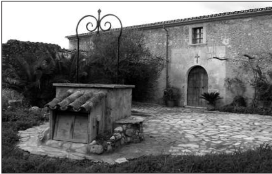
Rafal de Son Albertí i l'aljub

Durant tot el seu recorregut disposava de diverses fibres que permetien regar les terres per on passava, a cada costat del camí vell d'Artà-Lluc. Hem de dir que històricament la zona d'horta ha canviat de posició, com ho demostra el topònim s'Hort Vell. A les cases s'omplien 2 grans aljubs, per a les necessitats domèstiques i per al reg del jardí. El jardí també disposava d'una bassa decorativa. Algunes vegades a l'any l'aigua es feia arribar al rafal de Son Albertí, per regar i omplir l'aljub, situat a més de 4 km de la resclosa. Al segle XX, s'utilitzaren les aigües per omplir els grans safrejos de sa Central, al costat de les cases (central elèctrica que proporcionà corrent a Búger i Campanet).