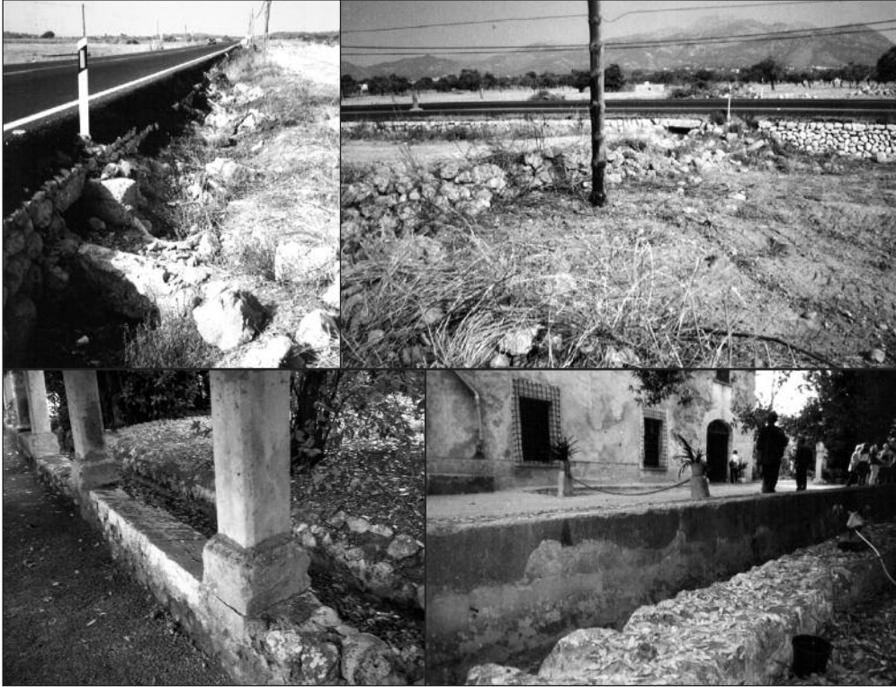
La síquia, creuant la carretera Palma-Alcúdia i davant les cases de Son Vivot.

Després la síquia continuava aferrada al camí, fins a creuar el camí vell d'Inca a sa Pobla. Abans de creuar-lo hi havia una altra fibla que permetia regar les terres dites es Figueral, creuant també el camí d'Artà a Lluç, igualment que l'anterior.