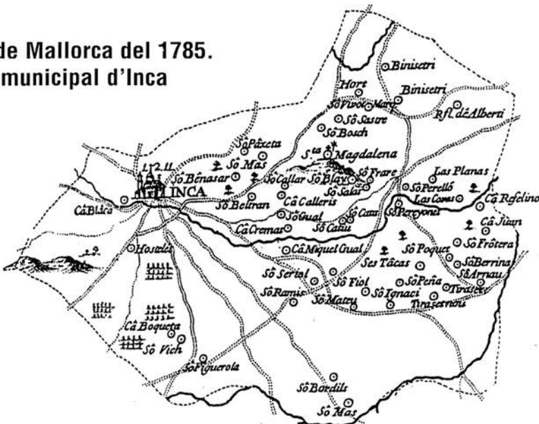
Mapa de Mallorca del 1785. Terme municipal d'Inca

La relació de Berard és el llistat que s'usa de primera referència. Si el mateix topònim és representat al mapa del 1785 hi consta la següent indicació: [=1785].