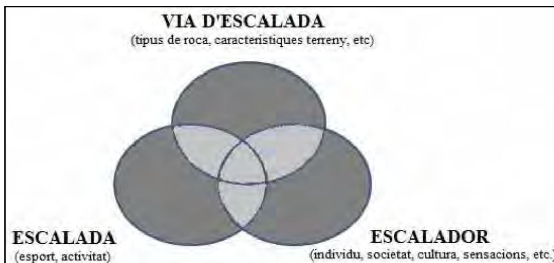
Figura 2. Interaccions que es produeixen a l'hora de fixar un nom d'una via d'escalada. Font: KUNA, 2011

El fet d'analitzar els motius pels quals es fixen els noms de les vies d'escalada és força complex. Hi ha moltes circumstàncies i molts components que influeixen en aquest procés, però bàsicament és el resultat d'una interacció que es produeix entre el concepte d'escalada (com a esport i activitat que és), entre la via ascendida (amb les característiques físiques del terreny i la roca) i l'escalador mateix (com a individu pertanyent a una societat determinada, amb una cultura heretada i/o construïda, i amb un entorn privat, i com a ésser humà, amb els seus sentiments, sensacions i experiències viscudes) (KUNA, 2014: 1235).