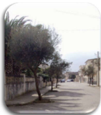
Fotografia 2. Carrer de la Pagesia

5. Relacionats amb l'ocupació laboral: carrer de la Pagesia, en honor a l'activitat agrícola de temps passats, carrer dels Cantoners, relacionat amb l'extracció de cantons de marès, placeta des Peix, carrer de les Gerrerries, carrer de s'Era Vella i carrer de les Missions, referent a les nombroses missions que fundà fra Juníper Serra a Amèrica.