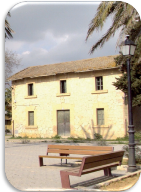
Fotografia 5. Antiga estació de tren i plaça de la Constitució