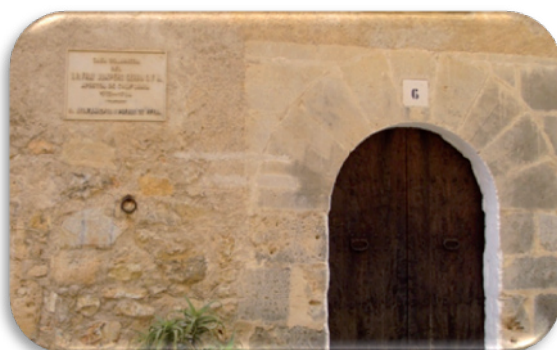
Fotografia 6. Casa pairal de fra Juníper Serra

Una altra aturada important és el convent de Sant Bernadí de Sena, on l'any 1609 ja hi havia una petita església. Podem esmentar que els frares no sols es dedicaven a temes religiosos, sinó que part del temps l'invertien en l'educació dels al·lots del poble. Cal no oblidar que just darrere el convent hi ha la placeta des Convent, on es poden observar il·lustracions de temes religiosos.