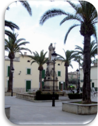
Fotografia 4. Plaça de Fra Juníper Serra

Ja dins el nucli històric del poble no poden faltar les dues places característiques de Petra. La primera és la plaça de Juníper Serra, on s'observa el seu monument, cal dir que anteriorment fou la