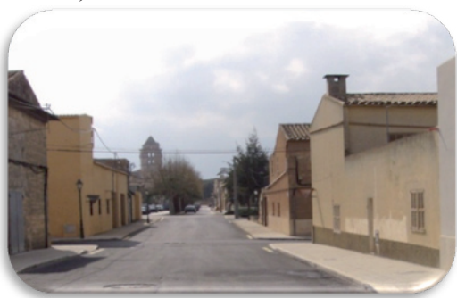
Fotografia 3. Carrer de la Revolta Forana