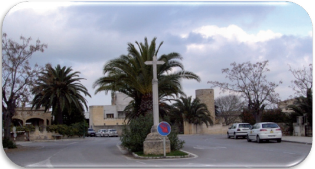
Fotografia 7. Plaça de sa Creu

En relació amb l'itinerari presentat, ofereix la possibilitat de mostrar a l'alumnat i a la societat en general diversos aspectes de la història i de la seva evolució fins a l'actualitat, no només del poble de Petra sinó també de les Illes Balears i del conjunt de l'Estat espanyol. El recorregut inclou explicacions sobre els oficis anteriorment exercits, l'illa abans de l'arribada del cotxe, els estils dels edificis més importants del nucli, els fets més significatius i els personatges més il·lustres de Petra i de les Illes Balears.