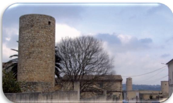
Fotografia 1. Carrer des Molins