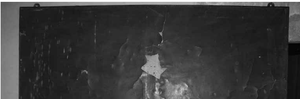
Fig. 4. A) Secció d'un bogamari fòssil, Clypeaster sp., que dona nom als espeleotopònims de 2n ordre Sector i Galeria dels Clypeasters de la cova des Pas de Vallgornera (Lluçmajor - Mallorca). (in Merino et al. , 2007); B) Crani i altres ossos de Myotragus sp. que han motivat l'espeleotopònim de 2n ordre de la Galeria dels Myotragus a la Cova Genovesa o Cova d'en Bessó (Manacor - Mallorca). (in Gràcia et al. , 2003b).