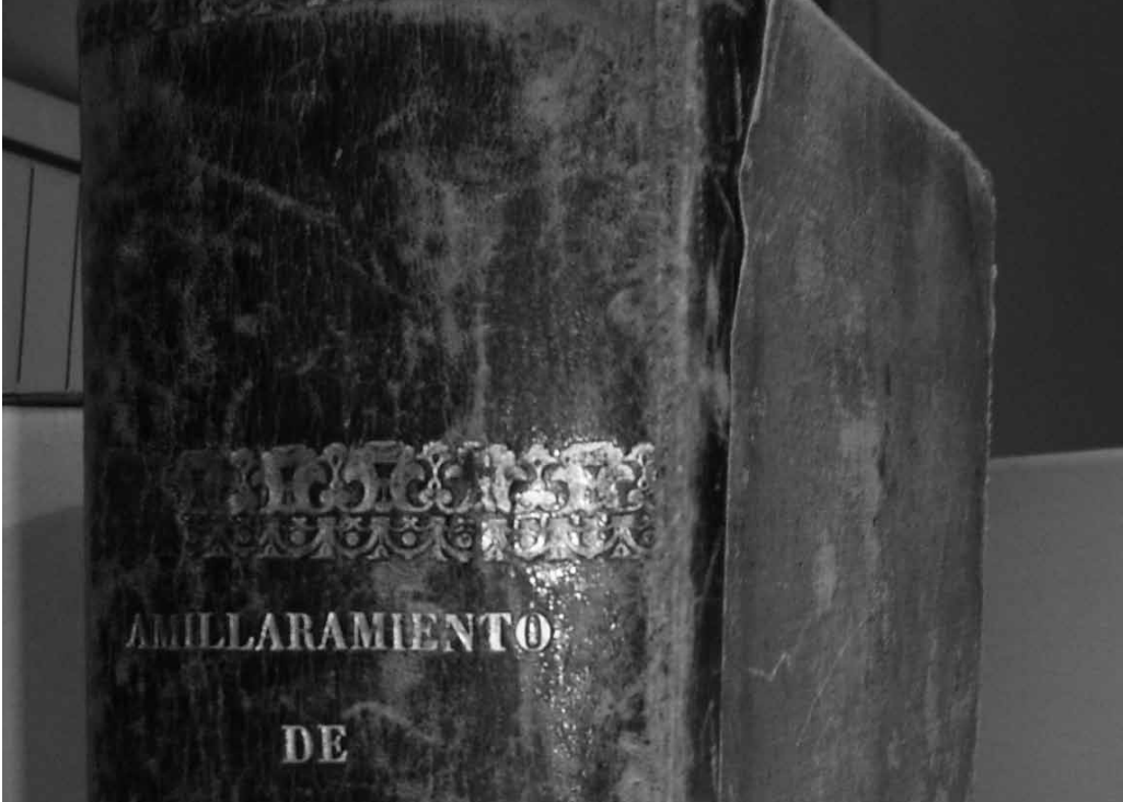
Fig. 1. Paleontologia Cultural i patrimoni etnopaleontològic, amb especificació de les distintes categories de toponímia de motivació paleontològica de les Illes Balears.