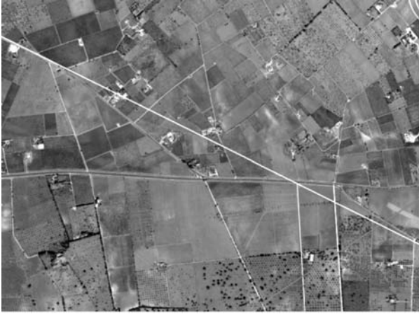
Figura 5. Es pot apreciar com els dos trams en què queda dividida la carretera de Santa Eugènia que discorre sota l'eix de 60° (en blanc) cerquen la mínima distància en el seu acostament a la de Sencelles.

posteriorment dins la garriga del puig. Aquest camí té per destinació, per un costat la carretera de Sineu vorejant la seva ermita i esvaint-se abans d'arribar a la possessió de Son Tano, i per l'altre costat es dirigeix a la població de Pòrtol en una doble ramificació.