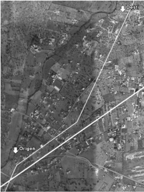
Figura 3. Blanc; direccions teòriques, vermell; arrodoniment de l'angle, Groc; eix principal «EP».

interromputs a un costat per la zona elevada que existeix en la zona de Ca na Floreta, i per l'altre a la seva intersecció amb el traçat de la via del tren, però un d'ells és materialitzada en una traça parcel·lària a l'altre costat de la via, la qual es pot seguir segons aquesta orientació fins creuar-se amb l'actual camí del Raiguer. Veurem com el primer té una rèplica més al nord que serveix per accedir al comellar des Cabàs on es troba un dels jaciments romans del terme. De la mateixa manera podem trobar-ne un altre de paral·lel que dona accés al comellar de Can Morro.