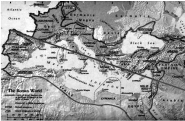
Figura 2 . La línia del decumanus d'Agrippa sobre l'imperi d'August unint l'orient amb l'occident deixant, Roma al centre geomètric.