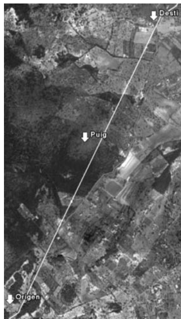
Figura 4. Darrer tram en arribar a Alaró pel coll de sa Creueta. En blanc línia teòrica i en vermell traçat real.

Un altre camí que porta aquesta mateixa direcció de 30° respecte a l'eix principal és el tram de camí que es troba al terme de Marratxinet, i que perllongat uneix la capella d'aquest llogaret 7 amb l'església de Sant Marçal. Sabem que aquesta església és força moderna, (construïda entre els segles XVII i XVIII per Lluç Mesquida ) però també és conegut un jaciment 8 que es troba parcialment sota és d'època romana, possiblement un assentament tipus vila. A l'altre extrem ja dins del terme de Santa Maria, la prolongació del camí que estem definint va a parar a una zona coneguda com es Rafal on podem trobar una altra traça perpendicular d'una longitud igual a banda i banda. Per tant, tant la vila romana que es troba en un extrem, com la coincidència en la direcció de l'eix de la via que uneix Santa Maria amb Alaró, i amb el fet que es creui en el punt mig de la traça perpendicular associada a ell, donen un triple grau de validesa com a via traçada originàriament en època romana.