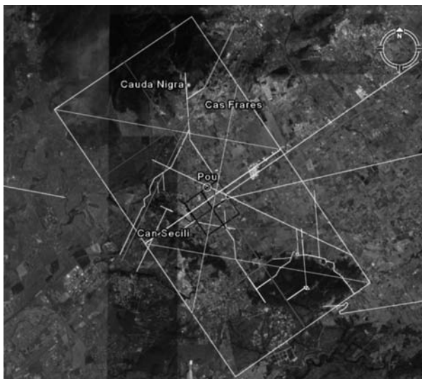
Figura 7. Esquema general de les traces exposades. En groc les dues centúries de 160 actus de costat, en vermell la divisió en quadrants de les centúries i el traçat del camí del Raiguer, en blau la divisió de l'espai agrari en 4 actus, en cian les diagonals de les centúries, en morat l'eix virtual del camí d'Alaró, i en blanc la resta de xarxa viària que suposem d'origen romà.

en direcció perpendicular a l'eix d'Alaró descrit anteriorment, de la qual es pot reprendre la seva trajectòria a l'altre costat del poble sortint en direcció a Santa Eugènia. En aquest punt trobem dues carreteres; la que es dirigeix pròpiament a Santa Eugènia amb aquesta mateixa orientació de 60°, i la bifurcació que transcorre amb una direcció exactament paral·lela a la carretera de Sineu, i es dirigeix en sentit al camí de Muro que es desenvolupa al llarg d'uns 7600 m paral·lelament a l'eix principal.