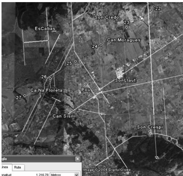
Figura 9. En blanc el traçat dels camins, en gris els eixos virtuals que se sobreposen als jaciments i camins, i en groc la distància en metres referida al vèrtex inferior de la imatge.

Les distàncies que separen els tres camins que donen accés als comellars de Can Morro, el des Cabàs i el de Coanegra són pràcticament iguals a 1200 m. Aquest darrer tram de camí de Coanegra i el que hem dit puja al puig de Son Seguí dirigint-se en direcció nord-sud solar a l'ermita, queden separats per una distància triple de l'anterior. Al mateix temps es poden traçar dos eixos virtuals separats aquesta mateixa distància que es sobreposen respectivament, i al nord, sobre els jaciments de Son Llaüt i Son Credo, i al sud d'aquest darrer jaciment també al tram central (orientat segons el nord solar) de la carretera Ma3010. Si marquem les milles romanes (de 1478,5 m) sobre l'eix principal, prenent com origen el Fòrum de Pol·lèntia per sobre del qual passa l'eix principal, resulta que totes aquestes traces se sobreposen, amb exactitud considerable, respectivament a les milles 22, 23, 24, 25, 26, i 27. Sobre la milla 26 també es superposa l'eix de la carretera d'Alaró (Figura 9), i el camí del jaciment que es troba darrere de Sant Marçal es sobreposa a la milla 25.