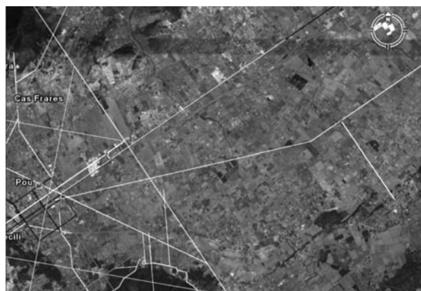
Figura 8. Situació de l'eix principal sota el qual es desenvolupa majoritàriament el camí del Raiguer (al nord en vermell), La carretera Palma-Alcúdia (en blanc i continua en blau), Camí de Muro en blanc i Morelló (al sud en blanc). El primer i segon separats ¼ de centúria i els altres tres ½ de centúria.

La distància que separa l'actual carretera de Palma-Alcúdia (agafant de referència el tram que sembla més genuí al seu pas vora el poble de Binissalem) i el camí de Muro en