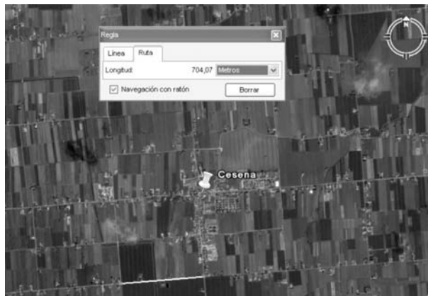
Figura 6. Municipi de Cesena al Pice Italià ocupat per la tribu Velina a la qual va pertànyer Quint Cecili Metel.

Un altre eix fonamental en l'ordenació de la trama urbana del poble que ens ocupa és la carretera de Bunyola. Aquesta carretera entra al casc urbà en una direcció que forma 60° amb l'eix principal, i per tant