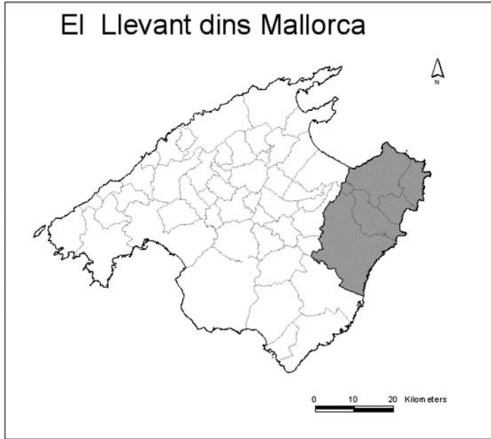
Mapa 1: El Llevant dins Mallorca

Una interacció que inevitablement passa per anomenar els elements que integren el territori. Tot l'anterior òbviament condicionat pel context historiogràfic i les condicions del medi primigeni. A partir d'aquest moment, la progressiva terciarització de l'illa i la litoralització associada al desenvolupament del sector turístic, i els canvis en la ruralia marcats per l'abandonament de terres de cultiu, la rururbanització han estat les forces generadores d'un nou paisatge que és el que tenim els nostres dies. Tal com veurem, tot l'anterior es tradueix en l'existència d'uns paisatges agraris perfectament reflectits en la fititoponímia.