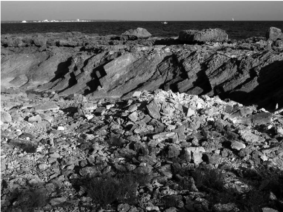
Antiga pedrera de marès dels voltants de s'Estanyol (Llucmajor).

Entrant, finalment, en la qüestió pròpiament toponímica –que és principalment antropotoponímica– els informadors de s'Estanyol coincideixen en l'existència i l'ús actual,