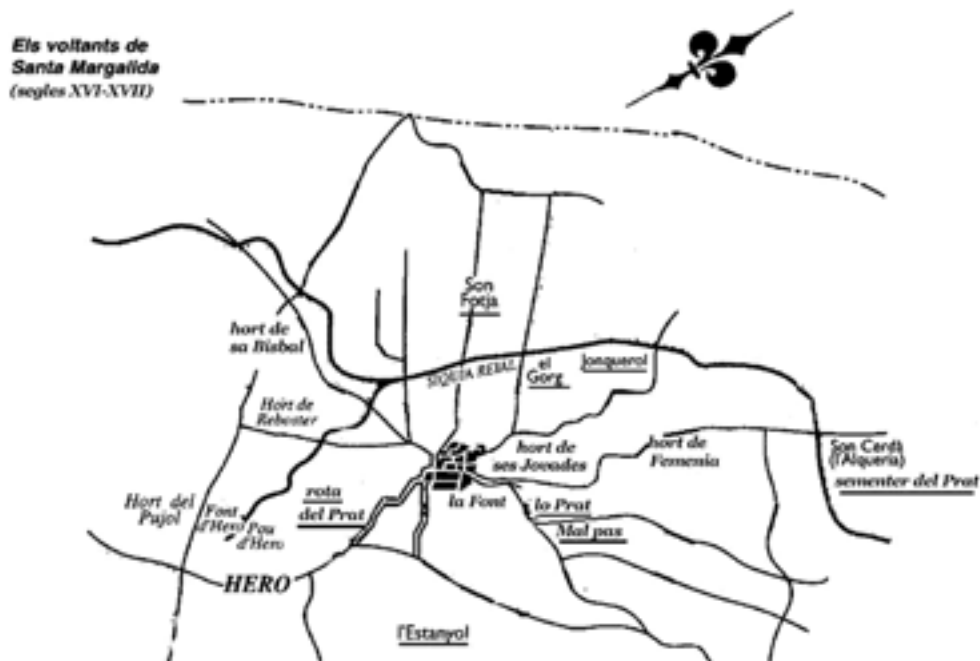
Font: Antoni Mas: Mapa de la Vila de Santa Margalida del segle XVII.

Topònim aplicat a diversos indrets dels voltants de la Vila, que tenen en comú ésser zones baixes i argiloses. Segons la tradició popular, els diferents indrets coneguts amb aqueix topònim reberen aqueix nom per les dificultats per passar-hi en temps de pluja, perquè hi quedaven encallats. Significativament, el camí Reial del Mal pas confrontava (1564) amb la sort anomenada lo Prat .