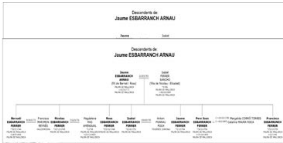
TAULA II - ARBRE DE DESCENDENTS DE LA PRIMERA GENERACIÓ ESBARRANCH CONEGUDA.

Donat d'alt grau de coneixement dels membres de la família, fruit d'una recerca intensiva als registres sacramentals, he pogut situar cronològicament a tots els individus coneguts en base al seu any de naixement. Així, he fet una taula i la posterior gràfica que, amb talls de 25 anys, situa als 134 Esbarranch localitzats fins a l'actualitat.