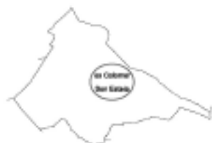
Terme municipal de Llorito