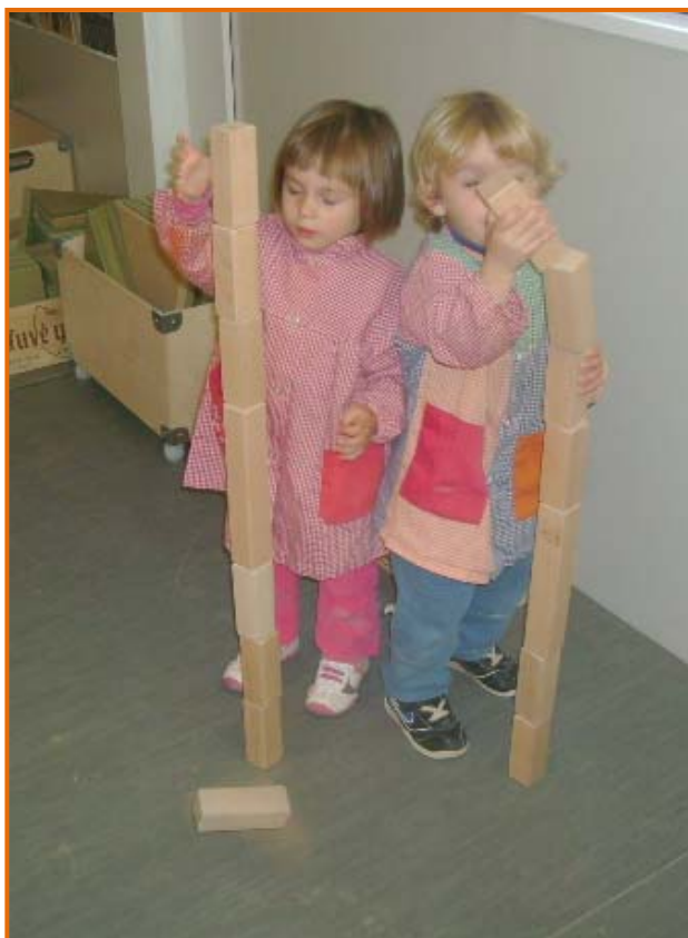
Figura 27. Les primeres construccions.