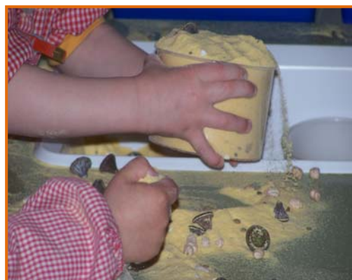
Figura 10. Maneig de farina de blat d'indi i llavors.