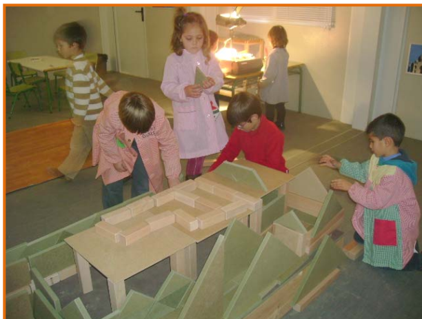
Figura 26. Fillets i filletes construint un vaixell pirata.