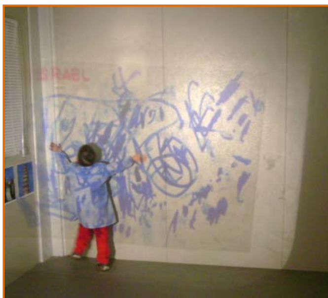
Figura 15. Immersió dins del dibuix.