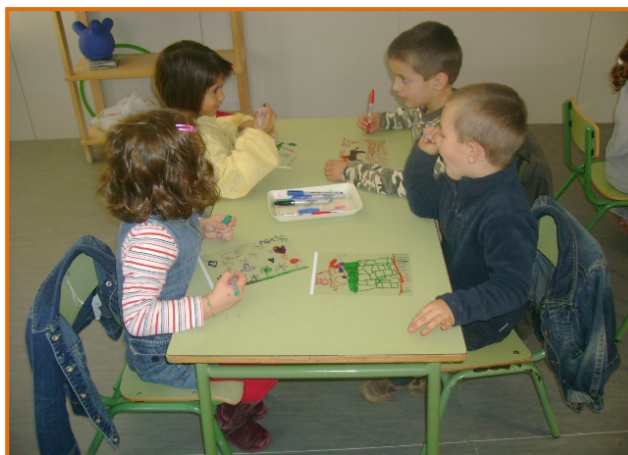
Figura 21. Fillets i filletes dibuixant per projectar.