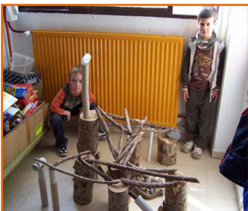
Figura 9. Racó de troncs.

Sabem que el veritable aprenentatge no es fa en un paper. L'infant ha de provar, ha de tocar, manipular, equivocar-se, moure's... La qualitat de l'aprenentatge radica en el procés i no en el resultat final