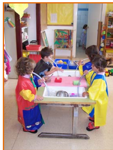
Figura 8. Fillets experimentant amb l'aigua.

Sabem que el veritable aprenentatge no es fa en un paper. L'infant ha de provar, ha de tocar, manipular, equivocar-se, moure's... La qualitat de l'aprenentatge radica en el procés i no en el resultat final