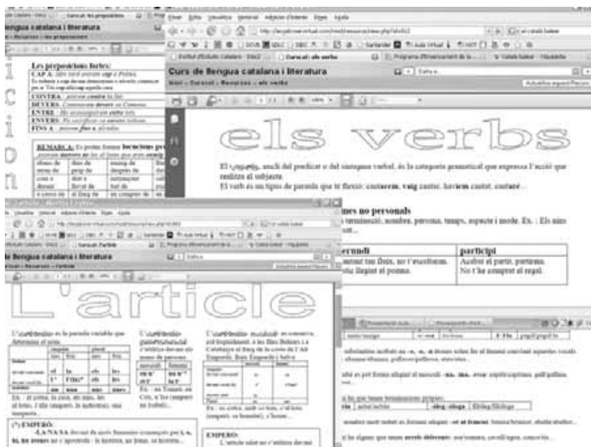
Imatge 3. Mostra de les fitxes de gramàtica.

2. Les presentacions de gramàtica. Són 24 presentacions en PowerPoint d'exercicis pràctics de les normes gramaticals. Gaudeixen de tres característiques importants que les converteixen en un mètode innovador i de gran eficàcia a l'hora de millorar la competència escrita: