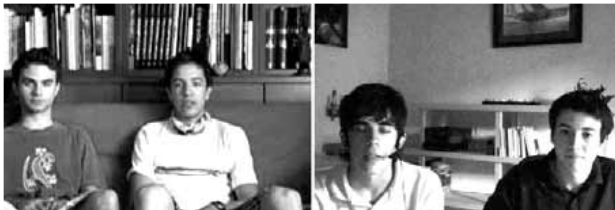
Imatge 2. Alumnas realitzant expressió oral i interactuant a través de càmera web fora de l'horari lectiu.

sam d'un ordinador connectat a un projector. Així, la pantalla on es projecta la imatge fa la funció de pissarra (de moment, no disposam de pissarres interactives). Per tant, a través de les projeccions podem fer feina amb les quatre habilitats lingüístiques: comprensió oral (escoltant un vídeo, per exemple), comprensió escrita (llegint un text projectat), expressió escrita (fent els exercicis projectats) o expressió oral (comentant, per exemple, un text o un vídeo).