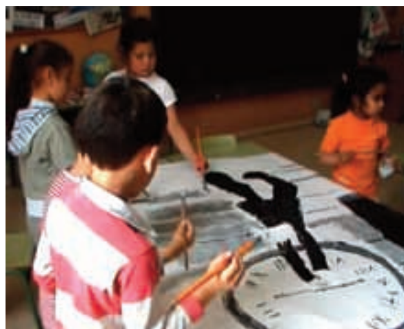
Fig. 2. Llista de personatges