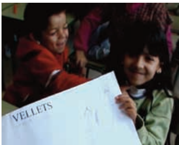
Fig. 4. Mural de Harold Lloyd