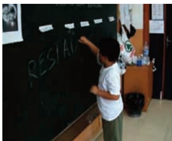
Fig. 5. Pensant el títol