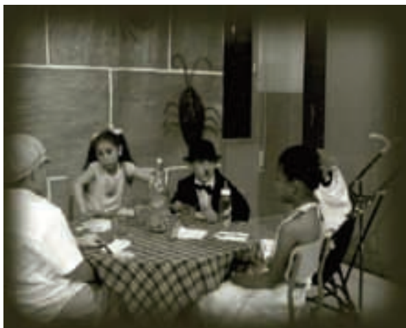
Fig. 6. El restaurant de la gent

Totes aquestes activitats s'han dut a terme durant més de tres mesos.