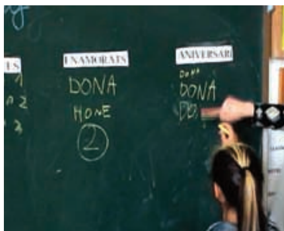
Fig. 3. Estudiant les accions