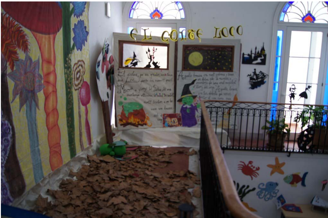
A la primera planta, els estudiants aprofitaren el lloc per muntar-hi tot l'escenari d'una petita obra de teatre que van representar diferents vegades en el marc de l'assignatura Teatre a l'Escola Infantil.