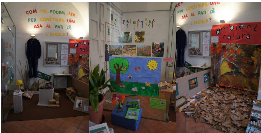
A continuació s'anaven obrint els diferents espais i racons dissenyats, com podem veure en aquestes fotografies.