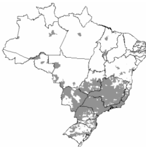
Figura - Municípios que registraram a presença de Aedes albopictus no período de janeiro de 1997 a dezembro de 2002, segundo dados do Sistema de Informação em febre Amarela e Dengue/ FUNASA e informações complementares.