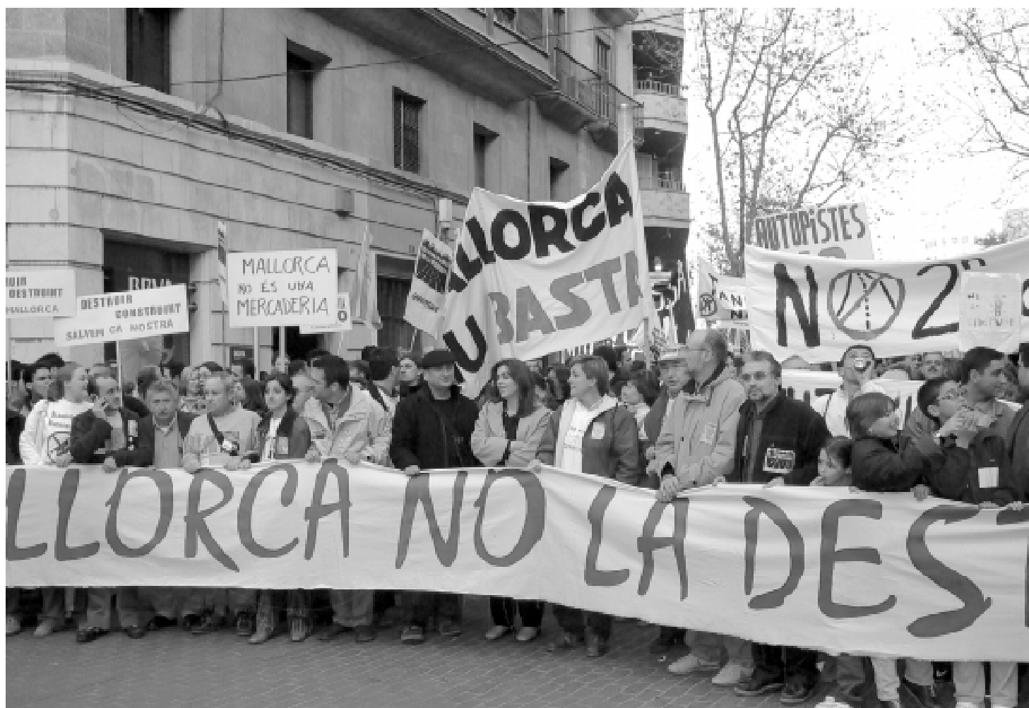
Manifestació ecologista. Les reivindicacions a favor del medi ambient són una constant de la història recent de les Illes Balears