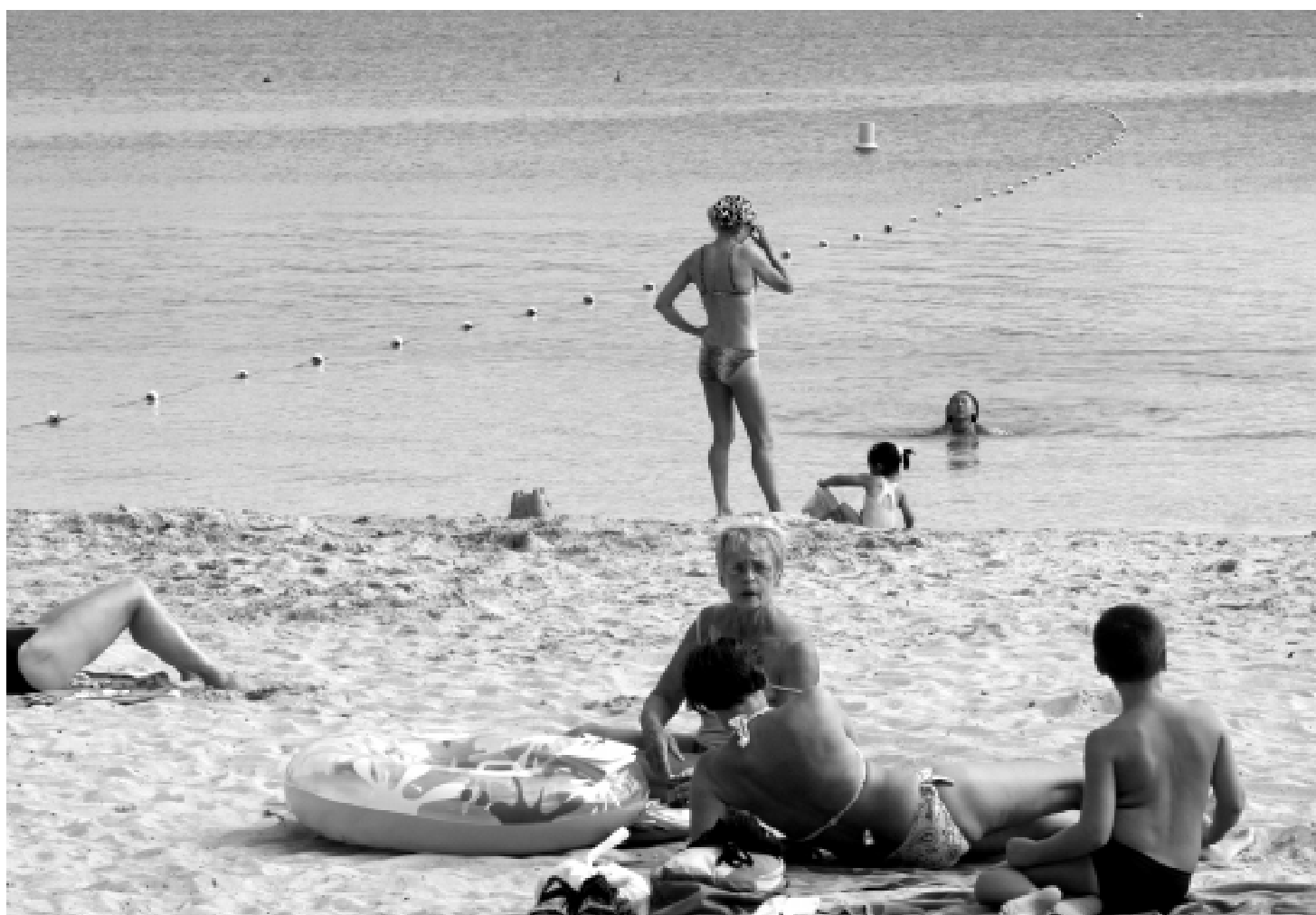
Els estius cada cop seran més llargs i calorosos. Imatges obtinguda a la badia de Pollença el dia de Tots Sants de 2006