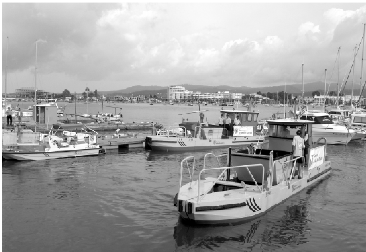
Invertir en medi ambient és vital per a una economia turística. Embarcacions del Govern dedicades a la neteja de la costa