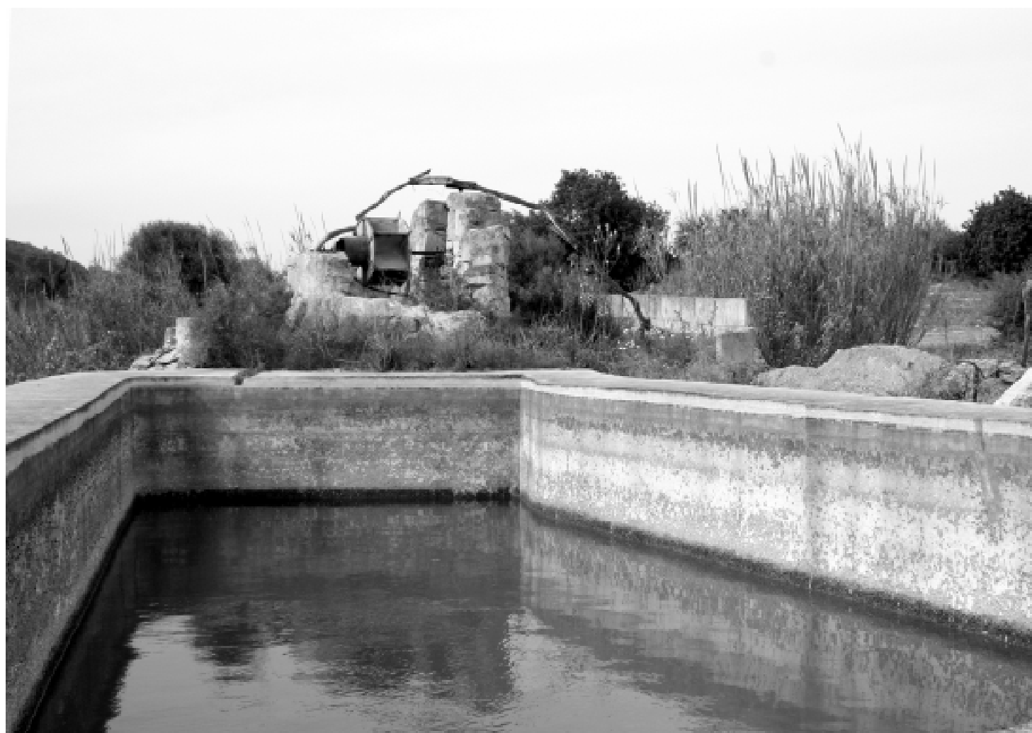
Safareig i sínia a Binifarda, l'arquitectura de l'aigua forma part important del patrimoni etnològic de les Illes