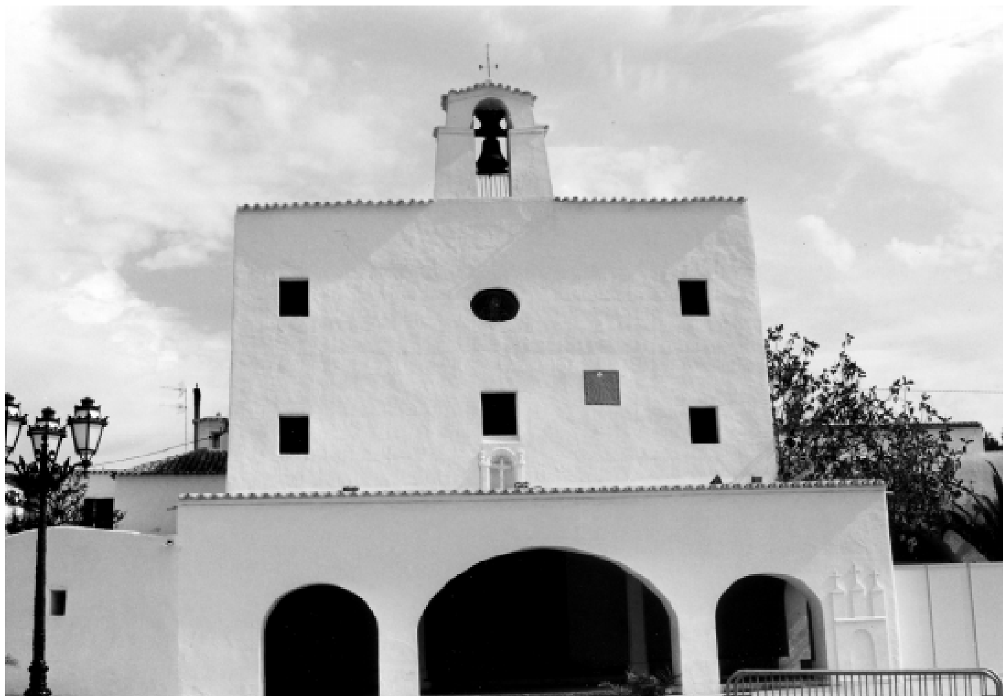
Sant Josep. Mostra d'arquitectura tradicional eivissenca. La preservació del patrimoni té una relació directa amb la conservació de l'entorn