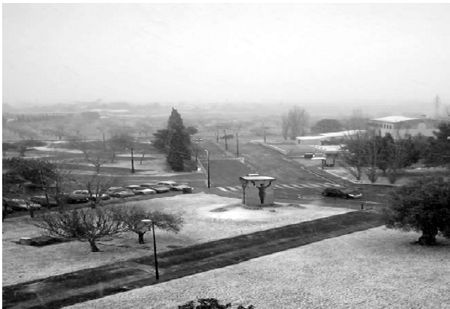
I els hiverns cada pic més freds i curts, com ho demostren les darreres nevades sobre les Balears l'hivern de 2005