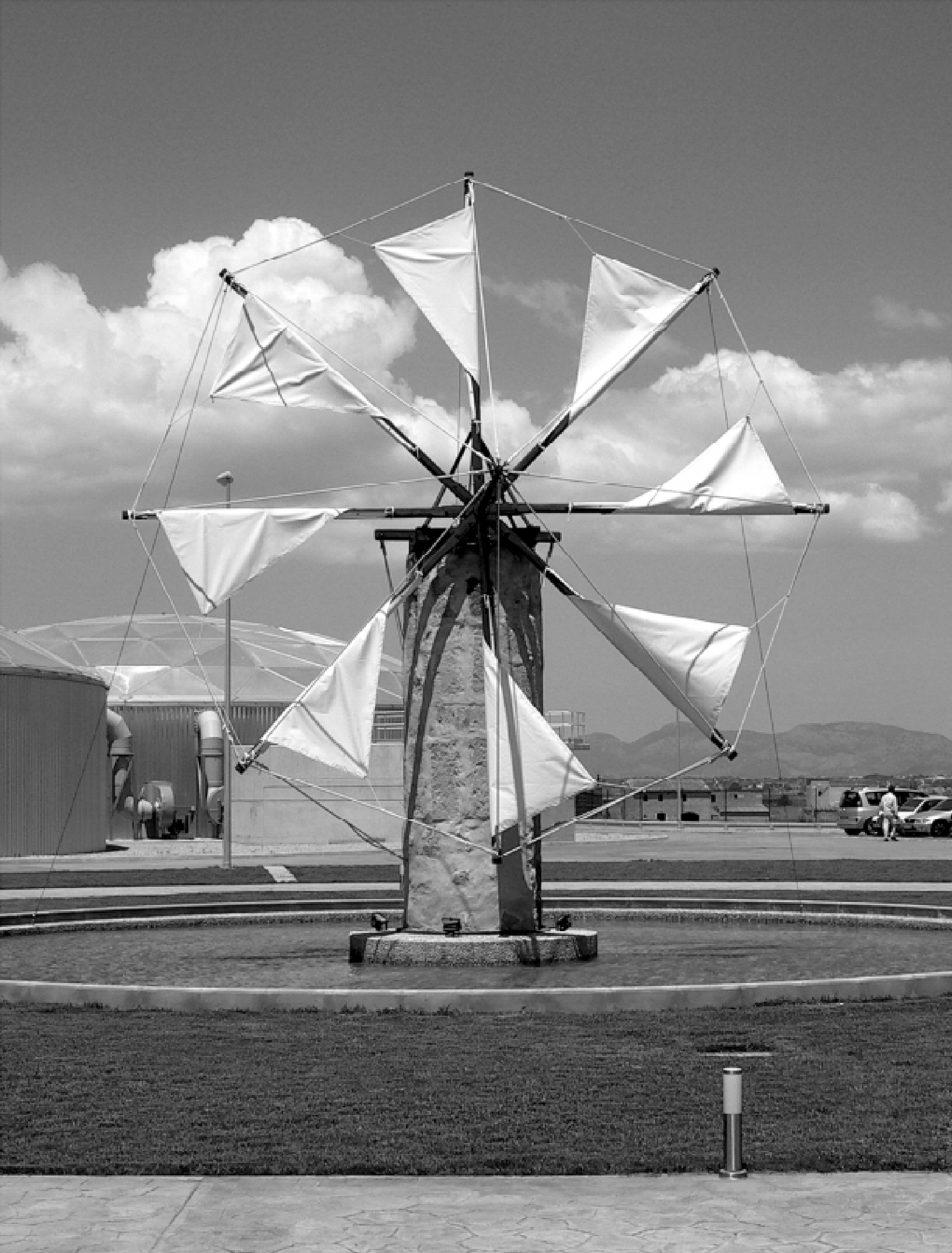
Antic molí de vent que va ser emprat per dessecar el prat de Sant Jordi i que ha estat restaurat al bell mig de la depuradora de s'Aranjassa