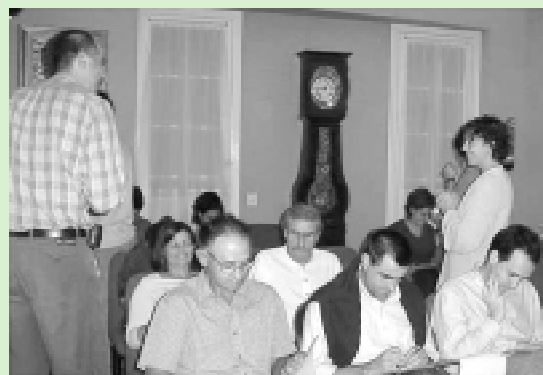
Es Mercadal: els tallers de participació són una eina imprescindible.

-La declaració de Reserva de la Biosfera constitueix un paraigua enorme sobre Menorca, del qual penja tot allò que es fa, perquè tot està relacionat amb poder mantenir la declaració. Per tant, les actuacions a Menorca tenen un component ambiental important i, en conseqüència, tots feim feina en aquesta línia. El Pla territorial insular també ens ajuda, perquè suposa posar un límit al creixement urbanístic, eliminar 70.000 places turístiques que hi havia programades, és a dir, no permetre que Menorca deixi de ser el que és i, per una altra banda, que no es pugui interferir en un desenvolupament econòmic sostenible i adequat. Aquest és l'equilibri que volem mantenir.