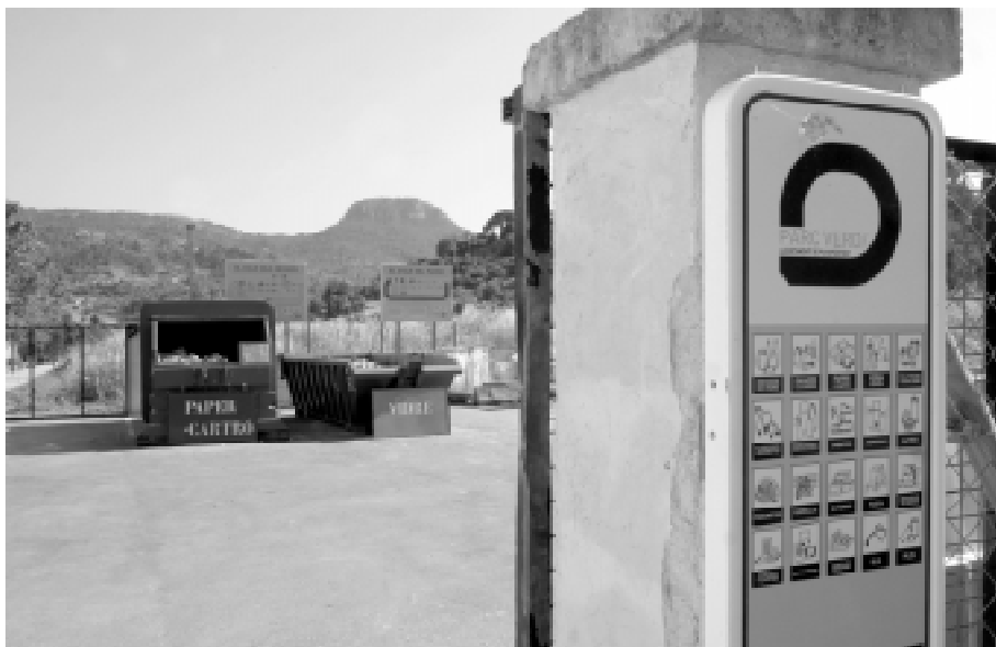
Reciclatge, alternativa eficient.

Feia vint anys de la primera gran cimera mediambiental, celebrada a Estocolm. Una de les ciutats de la societat del benestar havia estat l'amfitriona d'un fet extraordinari en plena guerra freda. Però aquesta guerra ja havia acabat i era hora de plantejar una nova reunió d'alt nivell, si bé per a aquesta ocasió les Nacions Unides s'estimaren més elegir una ciutat del Tercer Món. No debades s'hi havia de parlar de medi ambient, de pobresa i de desenvolupament sostenible. Per primera vegada hom sentia parlar de "sostenibilitat", un concepte encara no ben definit però que de llavors ençà s'empra indiscriminadament i exageradament. Els debats foren molts intensos i a la fi -abans que els favelistes poguessin tornar a circular lliurement per la ciutat- es donà llum verda a les declaracions finals i a l'aprovació dels programes d'actuació, entre els quals el Programa 21, que havia de suposar la redacció de la Carta de la Terra i el sorgiment de les agendes locals 21.