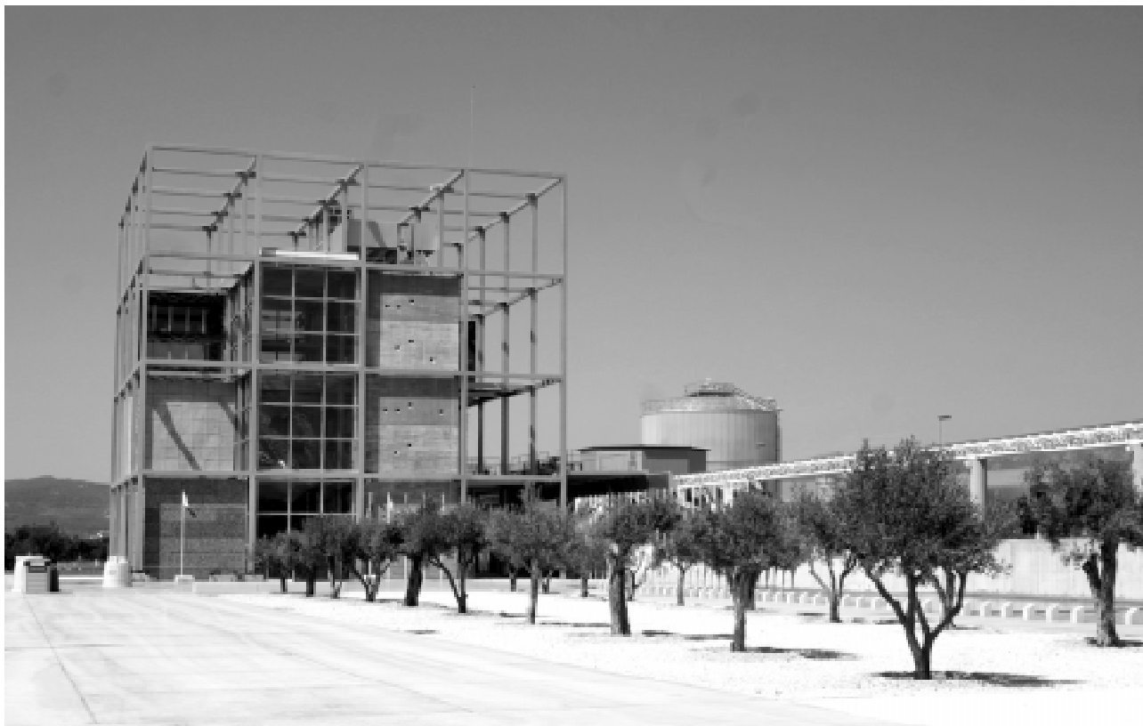
Parc de Tecnologies Ambientals

líders en el negoci mediambiental significa que també hem de ser en la inversió mediambiental. I és en aquest punt on decidírem actuar. I, després, hi ha un altre tema que també val la pena ressaltar. Ens hem adonat d'una cosa: que la paraula residu és una paraula pejorativa, té unes connotacions negatives. Però, en canvi, la paraula recurs implica tot el contrari. Llavors, al final, quan analitzes les coses, dius: tot això que jo empr per fer alguna cosa, tant sigui per reciclar com per produir energia, això no és un residu, és un recurs. Per tant, destinam la paraula residu només a allò que es tira, a allò que s'abandona. I, a la vegada, feim tot el que podem perquè el volum de residus sigui de cada vegada més petit.