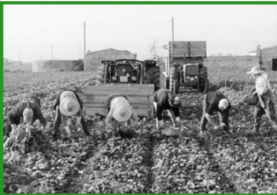
Collita de patata a sa Pobla.

El Pla de desenvolupament rural preveu subvencions que van des del 20% al 55% del projecte, en funció dels seus objectius i de la situació geogràfica de la finca o possessió que les reclama. Com a exemple, la màxima aportació pública serà per a iniciatives de joves agricultors en zones classificades de "desfavorides", com són els municipis de muntanya, Campos o ses Salines. Quant als projectes, el ventall és prou ample per poder atendre tota la complexitat del món rural i inclou, entre d'altres qüestions, l'agroturisme, la compra de maquinària, la reconstrucció de marges, el tancament de finques, la potenciació de la indústria agroalimentària, el cooperativisme agrari o el foment de l'agricultura ecològica.