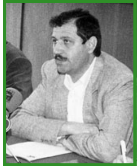
Mateu Morro, Conseller d'Agricultura i Pesca.

El conseller d'Agricultura, Mateu Morro, reafirmà a Manacor el compromís de l'executiu de les Illes Balears amb el sector primari que qualificà, un cop més, de sector estratègic de cara a un desenvolupament econòmic i social més equilibrat i sostenible. Però el conseller no volgué passar per alt que la situació que travessa la pagesia és difícil, que el 2000 va ser un autèntic annus horribilis i que el 2001 potser no sigui massa millor. La sequera, la llengua blava, les vaques boges i ara el temor al contagi del mal de potó fan del sector agrari un sector en vies d'extinció. Per evitar-ho, la Conselleria d'Agricultura ha posat data al Primer Congrés Rural que l'exconseller, Joan Mayol, anuncià tot d'una